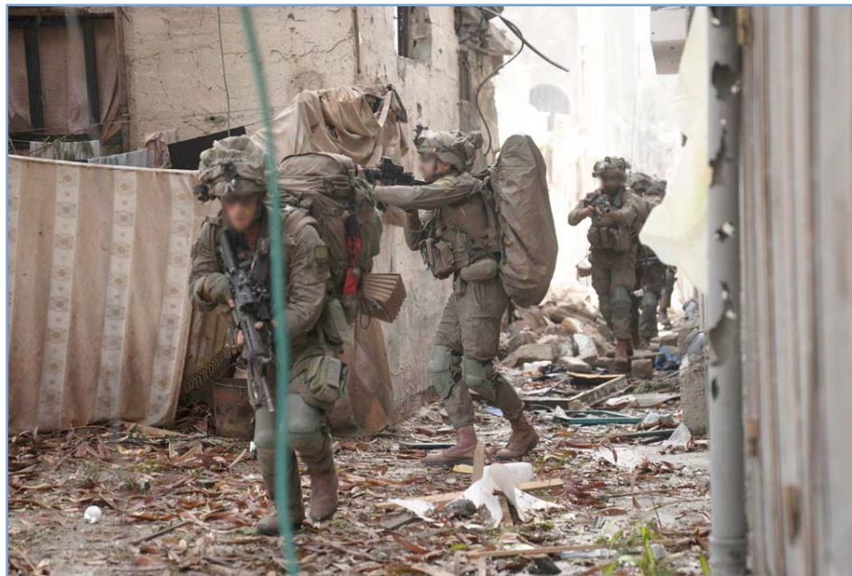
Fuerzas militares de Israel destruyen lo que queda de las viviendas

inteligencia en tiempo real a sus colegas militares sobre el terreno), a lo que se suman francotiradores robóticos capaces de disparar contra “intrusos” (como las ametralladoras de inteligencia artificial desarrollada por las empresas Rafael y Smartshooter, que pueden disparar granadas aturdidoras, balas de goma y gases lacrimógenos).