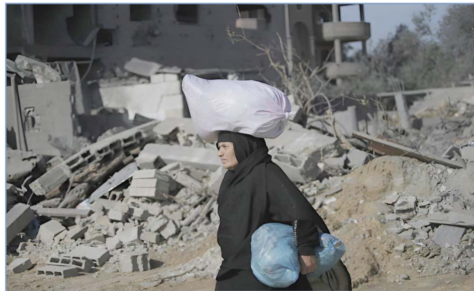
La destrucción es tal, que es imposible regresar

Gurión entre Arabia Saudí e Israel (alternativo al canal de Suez, por donde pasa 12% del comercio mundial), que debería desembocar en Gaza, lo que permitiría poner un cordón sanitario a la Ruta de la Seda china ... Y después seguir con la “limpieza” étnica de Cisjordania.