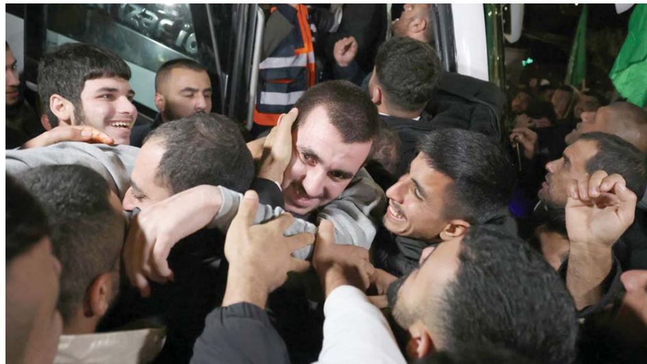
Israel libera a prisioneros palestinos