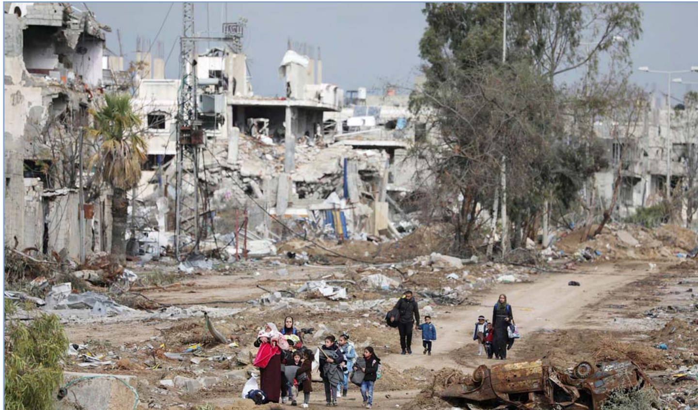
Con el paso de los días el régimen colonial y expansionista de Netanyahu elevó el urbicidio a su máxima expresión

Antes del 7 de octubre, y desde 1948 (cuando se produjo la Nakba [catástrofe], que dio inicio a la destrucción de la sociedad y patria palestinas mediante el desplazamiento forzado de población), la ocupación de los territorios árabes por sucesivos regímenes sionistas de Israel, ha involucrado una serie de procesos de dominación colonial y ocupación militar que incluye, hasta la configuración del actual apartheid automatizado, asentamientos de colonos supremacistas con armamento militar en puntos estratégicos alrededor de las principales zonas urbanas palestinas (como dispositivos panópticos urbanos [disciplinarios] para dividir el espacio y controlar las aldeas, lo que tipifica como crimen de guerra en virtud del Estatuto de Roma de la Corte Penal Internacional); la construcción de redes de vigilancia de alta tecnología (como el Cuerpo de Defensa de Fronteras, que recopila información mediante cámaras, dispositivos de detección y orientación mediante sensores acústicos, algoritmos informáticos y mapas, y son responsables de vigilar entre 15 y 30 kilómetros de terreno las 24 horas del día, proporcionando información de