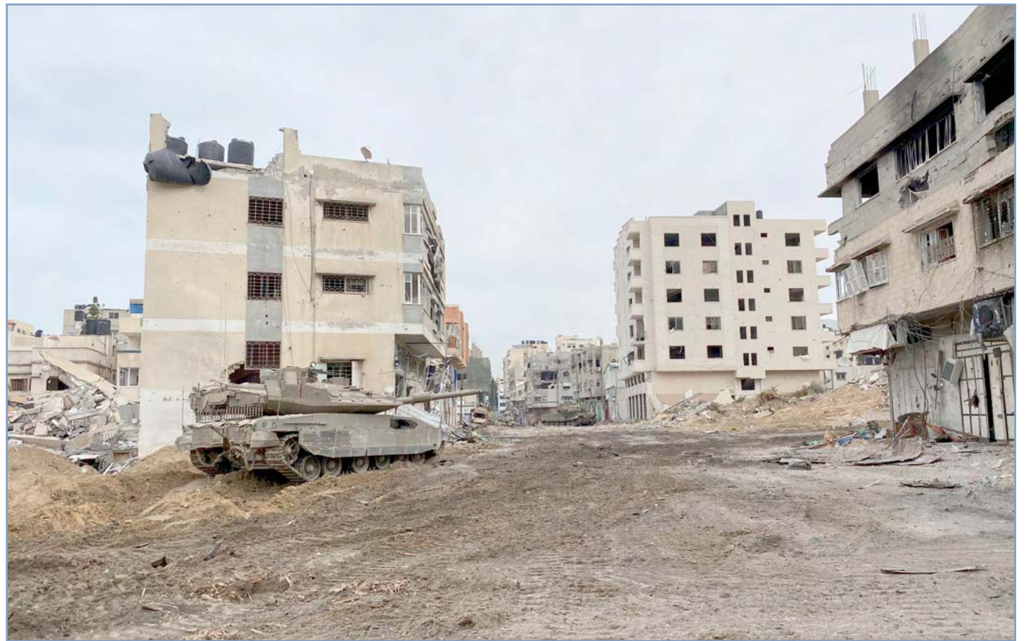
Fuerzas militares israelitas destruyen con las tanquetas lo que queda de las viviendas

Para el Likud y sus mandos ultranacionalistas, el objetivo es la despoblación total del norte de Gaza, empujando a los gazatíes que sobrevivan al genocidio hacia la desértica península del Sinaí en Egipto (como sugirió un documento interno del Ministerio de Inteligencia de la ministra Gila Gamliel) o a un “reasantamiento” en otros “países de acogida”. Es decir, desaparecer esa parte de Palestina o convertirla en una tierra vaciada de sus habitantes y abierta a la colonización –un verdadero “gran reemplazo”–, y apoderarse definitivamente manu militari de los yacimientos submarinos de gas natural situados en las aguas territoriales palestinas, como parte del proyecto de Washington y Tel Aviv de aterrizar el proceso de acercamiento entre Arabia Saudí e Israel, que incluía la construcción (ya iniciada) del Canal Ben