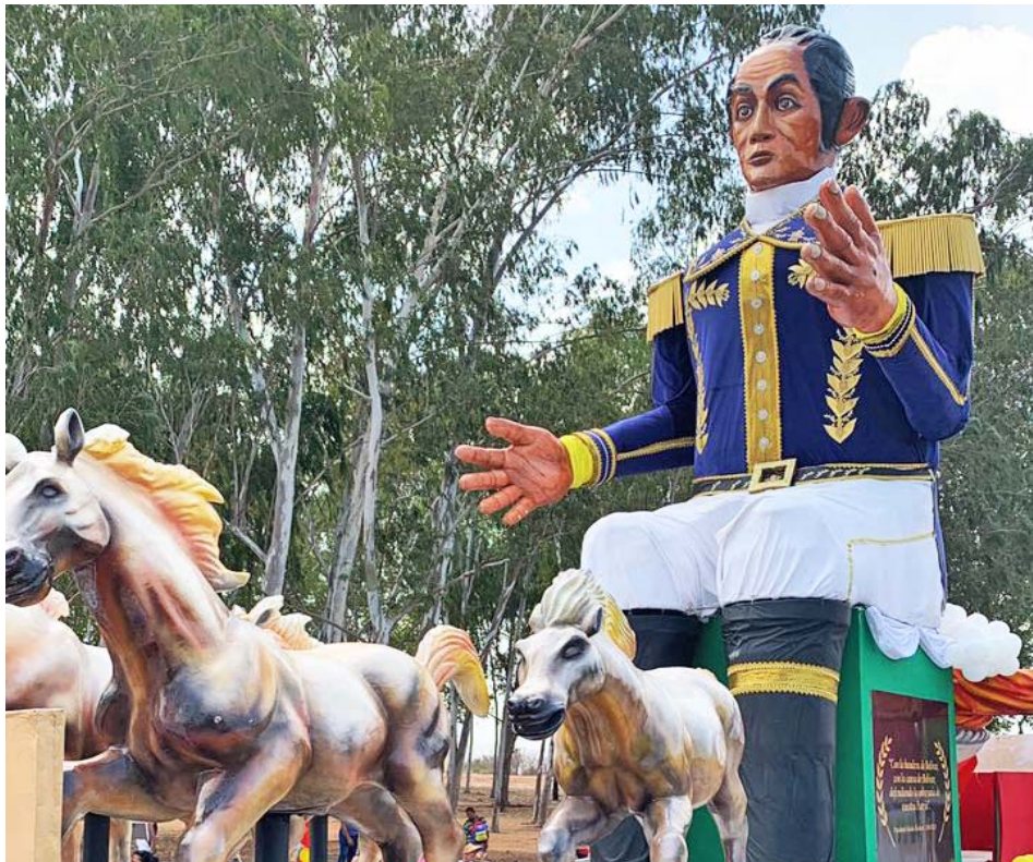
Todas sus imágenes son realizadas en fibra de vidrio para que duren

Desde Simón Bolívar hasta Bambi son algunas de las imágenes utilizadas