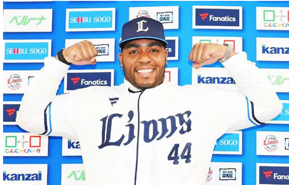
Aguilar tiene una década de experiencia en las mayores.

Se calcula que si Aguilar logra adaptarse a la pelota nipona, podría sacar en-