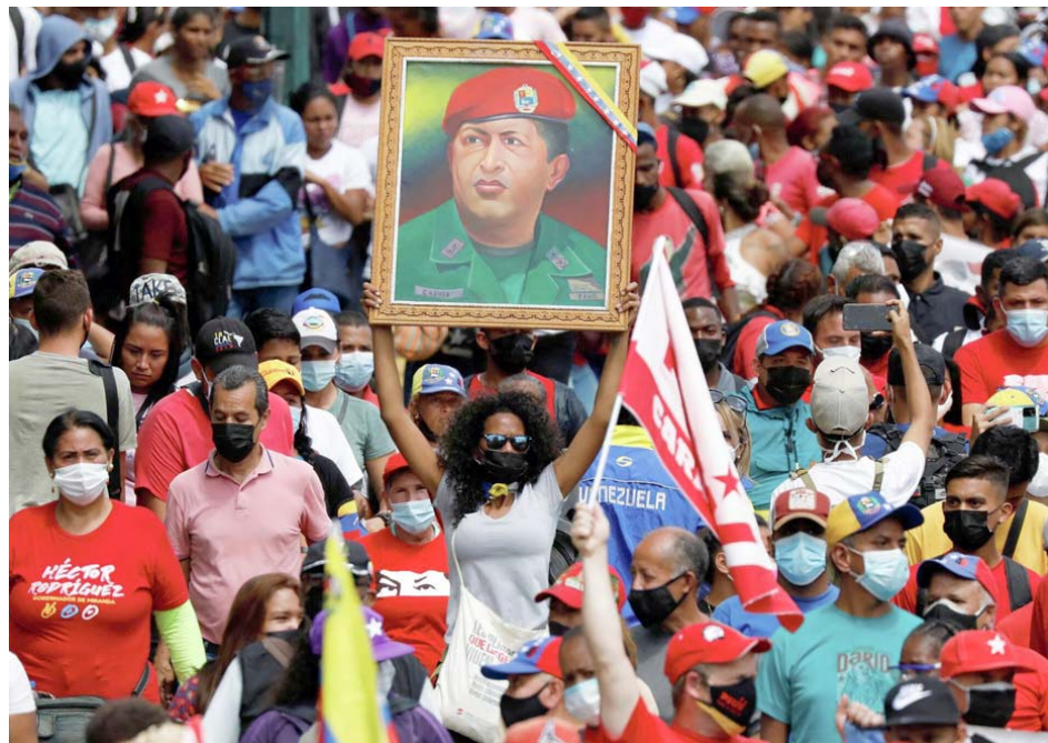
"Recordar a Chávez es traer su voz y su lucha por la emancipación de Nuestra América y del mundo"

Recordar su voz diciéndole a su pueblo "Y aquí en Venezuela lo que estamos haciendo es un esfuerzo gigantesco