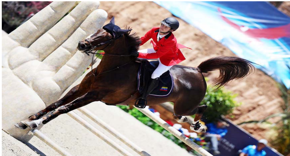
Con Condara tiene un binomio perfecto