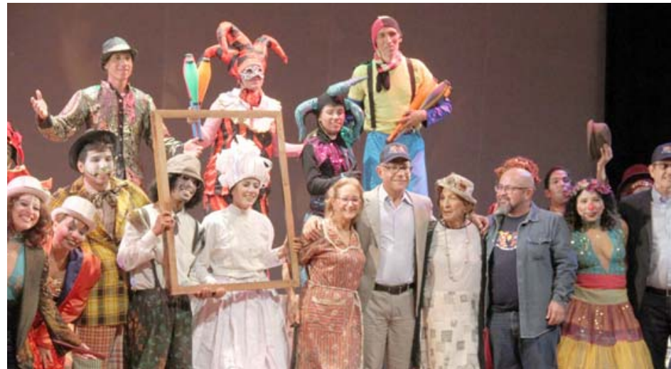
El teatro a pesar de todo siempre se realiza en Venezuela