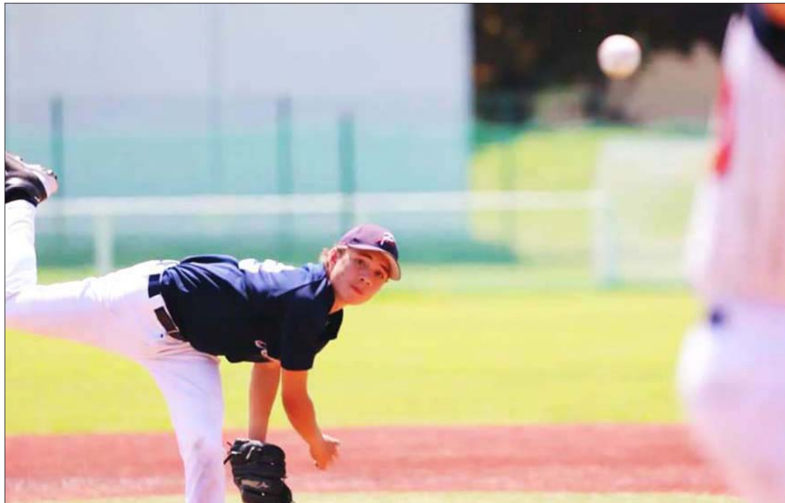
Con 15 años, su sueño es saltar al sistema MLB a mediano plazo

—Desde la categoría Sub-12 hasta la primera división se juega un beisbol en ascenso bastante competitivo. Esto explica el hecho de que cada vez hay más peloteros europeos con muy buen nivel que juegan en