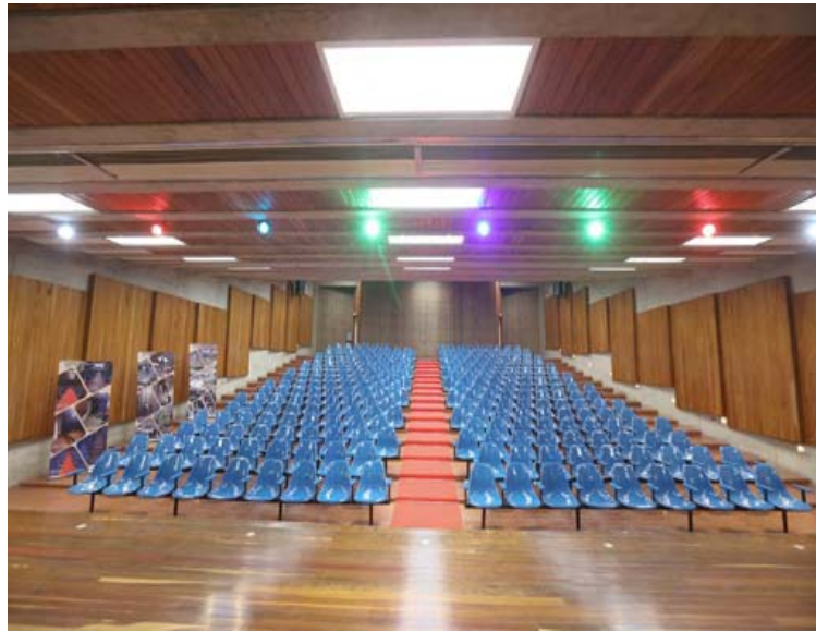
“La recuperación demuestra el espíritu del venezolano y la venezolana que nunca se rinde”, dijo la Vicepresidenta Ejecutiva