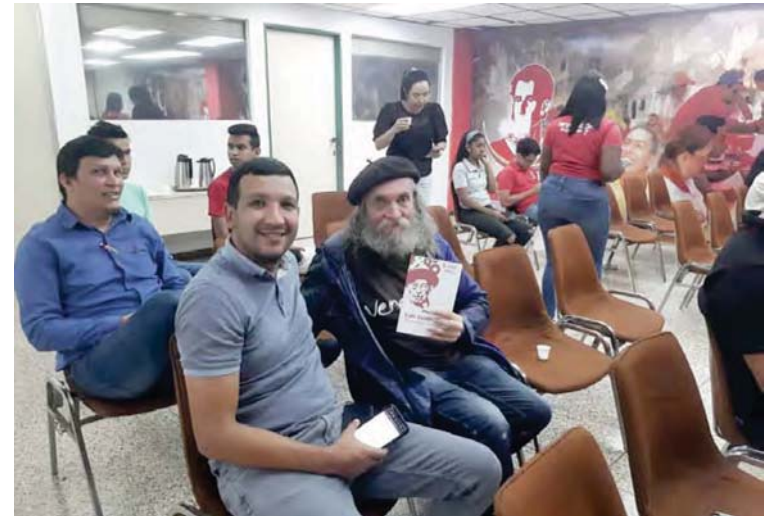
Trabajadores saben cuál es su papel en la Venezuela potencia

Por eso existen dos programas de becas que ofrece la Fundación Gran Mariscal de Ayacucho: becas nacionales e internacionales.