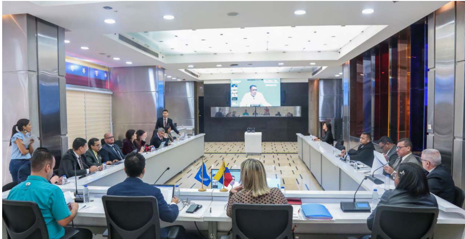
En la conferencia entre otros temas tratarán el financiamiento para acabar con el hambre y lucha contra el desperdicio de los alimentos

El país fue invitado a participar en la mesa redonda sobre la lucha contra los desafíos planteados por el nexo agua-bosque-biodiversidad-suelo en el contexto del cambio climático”, un espacio propicio para estrechar lazos con distintos países de la región