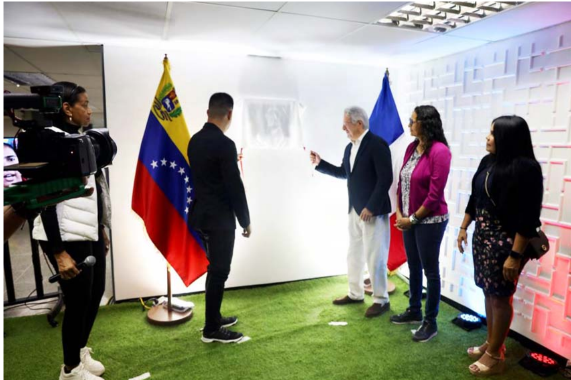
Yulimar Rojas en símbolo de la mujer emprendedora

El diplomático agregó que “Yulimar es una figura inspiradora, para todos aquellos que luchan por la igualdad de