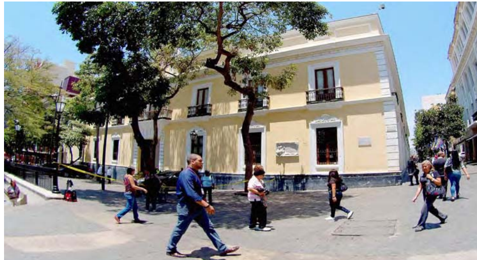
Casa Amarilla, sede de la Cancillería de Venezuela

La República Bolivariana de Venezuela rechaza de manera contundente