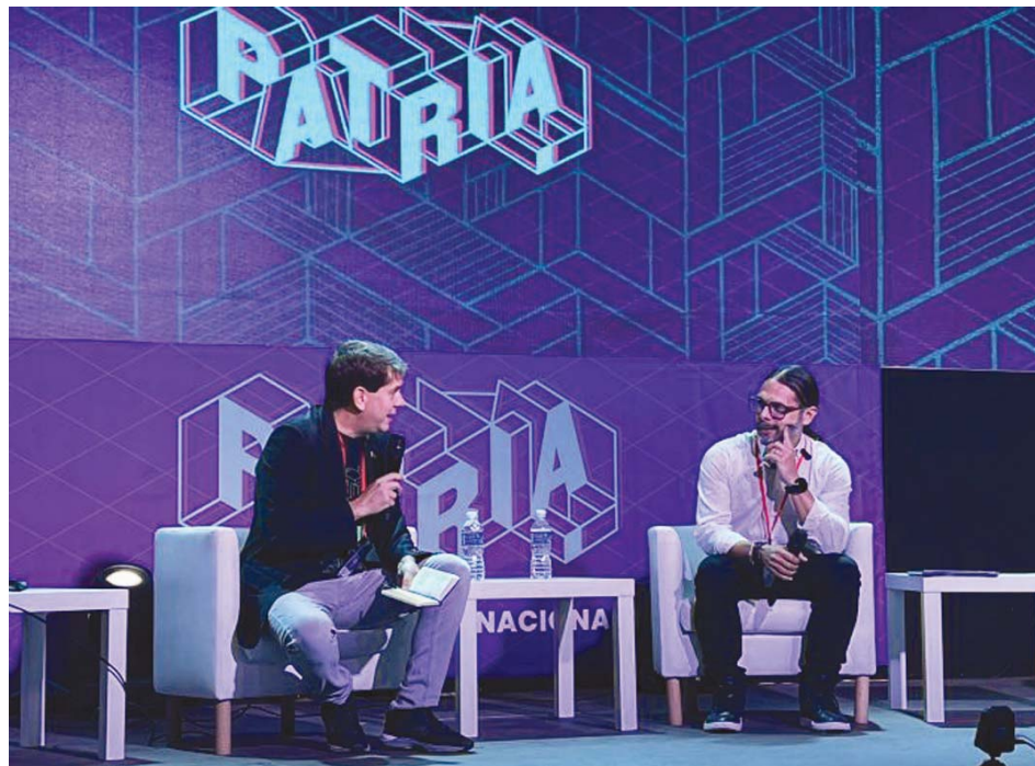
“Debemos avanzar hacia una articulación global entre Estado y trabajadores”, destacó Nájuez

El uso de las herramientas comunicacionales para hacerle frente al imperialismo tecnológico fue el tema abordado