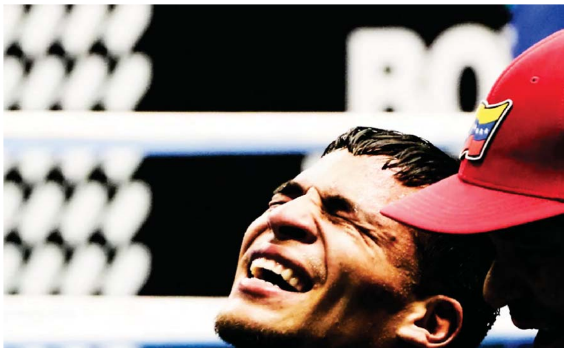
El hombre lloró de la emoción por su pase

El cumanés ganó la decisión parcial en el segundo round y