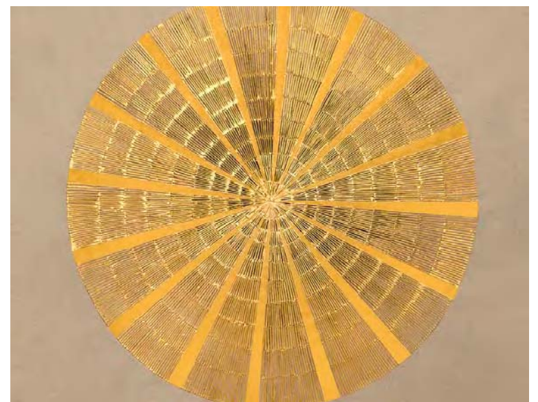
La churuata es un elemento fundamental en el discurso de la exposición