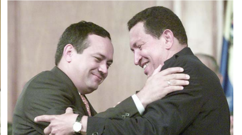
Diosdado Cabello entrega el poder a Chávez

se habían creado a lo largo del siglo XX, a punta de mentiras, telenovelas, enlatados y programas banales. En reacción, el gobierno de Chávez creó un sistema de medios bolivarianos que le permitió llevar al pueblo la voz de la Revolución y, por otro lado, entregó permiso y concesiones, a través de emisoras comunitarias, para que las comunidades tuvieran sus propios medios de expresión.