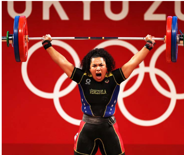
Naryuri Pérez va a sus terceros juegos olímpicos