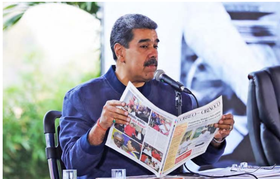
Disfruta leyendo el Correo del Orinoco

Entre los vértices se encuentran: La siembra y preservación del talento científico nacional: tiene como objetivo preservar, reserva y formar el talento del niño, joven y adulto; inicia en las escuelas, con el semillero científico, la ruta de la ciencia, salas experimentales y además impulsará los estudios de cuarto nivel tecnológicos y científicos en las universidades.