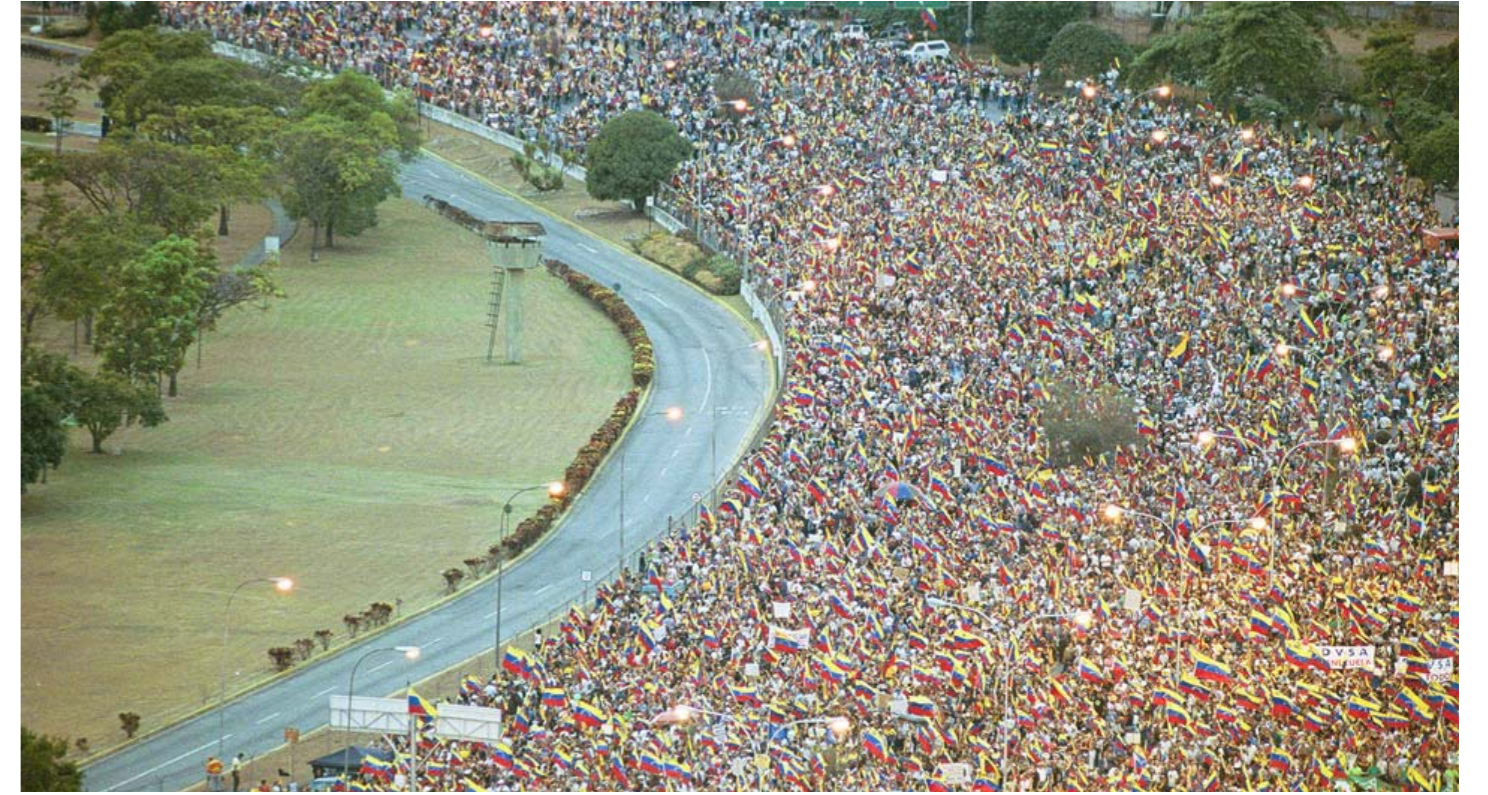
Marcha opositora del 11-A

En la noche del 13 de abril, con la detención de Carmona Estanga, el golpe ya estaba conjurado. La imágenes que mostraban a Aristóbulo Isturiz entrando a Miraflores, para tomar el palacio, trajo alivio a millones de venezolanos presos de angustia. La señal de Miraflores, ya restituida, transmitió el acto en que Diosdado Cabello le entrega el cargo a Chávez, que pocas horas antes había asumido en su ausencia. El Comandante llegó mostrando un cristo, y haciendo un