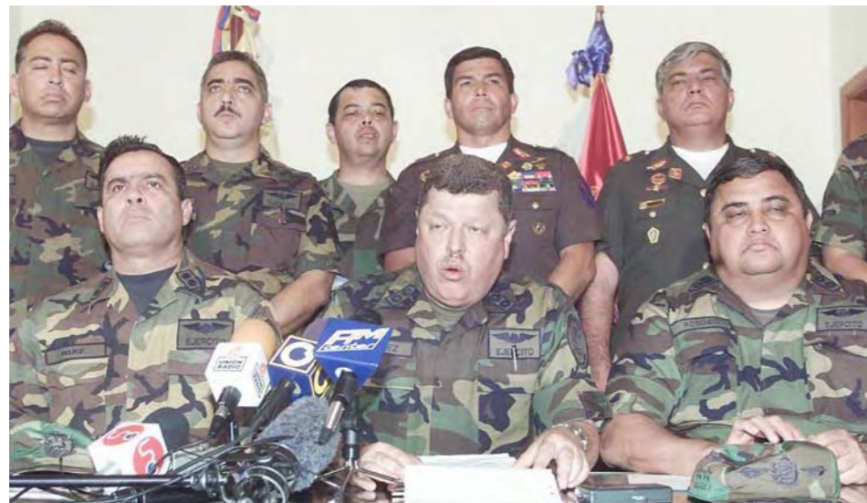
Los militares golpistas

llenos de estupor y angustia, presenciaron y siguieron las incidencias, de lo que posteriormente fue calificado como el “primer golpe mediático” de la historia de la humanidad. Ya no se trataba del clásico golpe de estado militar en el que un grupo de “gorilas”, así llamados, con el visto bueno de Washington, deponeían un gobierno democrático, generalmente de tinte progresista, a punta de tanques, cañones, bayonetas y muchos muertos.