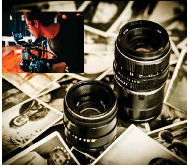
Ambos grupos de talleres tienen cupo limitado y son completamente gratuitos

Por otra parte, en el taller Plan de rodaje y presupuesto se explicarán los detalles sobre este documento, usualmente preparado por el asistente de dirección junto con el director de producción o jefe de producción, cuya función es visualizar y organizar los elementos, fechas, actores, horas, entre otros pormenores de un proyecto audiovisual. Esto es intrínseco al presupuesto, de ahí la importancia de aprender a realizarlo en fun-