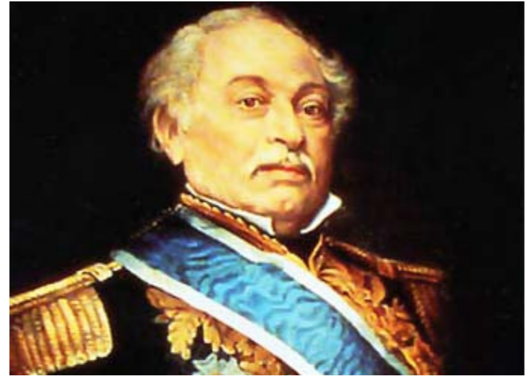
José Antonio Páez

Hasta ese momento Páez ha tenido una conducta aparentemente imparcial. Pero luego se traslada a Caracas y el 24 de diciembre de 1830 —con el pretexto de pedir una contribución para el mantenimiento del ejército— convoca otra asam-