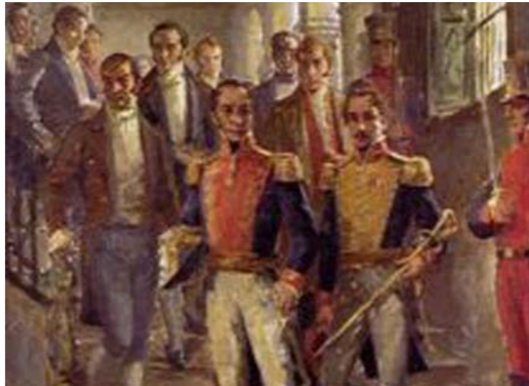
Bolívar y Santander, congreso de Cúcuta

“Las tendencias unionistas surgidas durante la revolución independentista desembocaron en la consolidación de bloques políticos, con la unión de varios países en una sola nación. Las ideas de Bolívar sobre los grandes bloques políticos y los planteamientos de los venezolanos y granadinos en el Congreso de Angostura (1819) y en el Congreso de Cúcuta (1821), dieron surgimiento al bloque político de la Gran Colombia, con la unión de Venezuela, Nueva Granada y Quito, y posteriormente con la anexión de Panamá, en 1821. Este gran Estado tuvo una duración de once años, entre 1819 y 1830. La Gran Colombia, en sus inicios, se convirtió en una esperanza para el progreso de los países integrantes: Venezuela, Nueva Granada y Quito, unidos aparentemente en identidad de origen, costumbres, problemas y medio geográfico. En la integración grancolombiana intervinieron diversos factores. La guerra de independencia enseñó a los venezolanos, granadinos y quiteños, que la cooperación era definitiva para llegar a la meta del triunfo de la revolución. Se pensaba, asimismo, que la