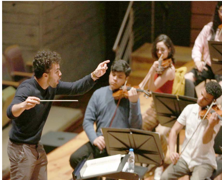
El director asistente del Royal Ballet de Londres está de visita en Venezuela