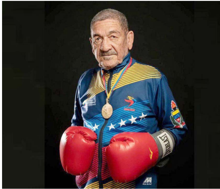
“Morochito” marcó un antes y después en Juegos Olímpicos

Victoria aquella ya distante que hizo llorar de emoción, y a la par reír de contento, a toda Venezuela, que en todos los rincones del país escuchó al recordado Carlitos González gritar al aire, transido de emoción, por