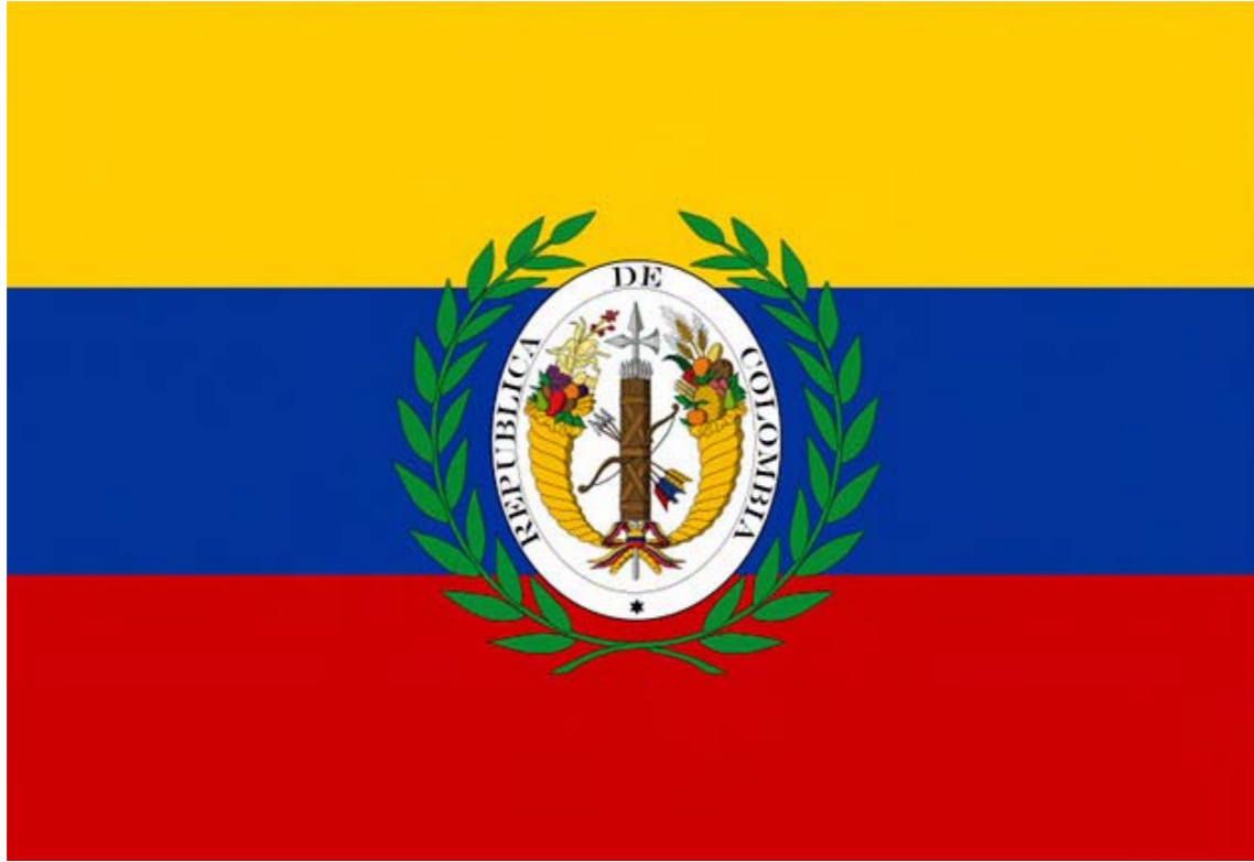
Bandera de Colombia, 1824

Un análisis sobre las causas que dieron al traste con la Colombia bolivariana fue hecho por el presidente Nicolás Maduro, en enero pasado, en el acto de la llevada al Panteón Nacional de los restos del general Domingo Antonio Sifontes. En su intervención, el presidente Maduro asomó la posibilidad y la esperanza de que en un futuro se produzca la reunificación de Colombia. La propuesta ha sido recogida con entusiasmo por la mayoría de los historiadores consultados, cada uno con sus matices. A la luz de los tiempos actuales la unión de los países bolivarianos se ventila como una necesidad imperiosa, en un mundo multipolar que se conforma en bloques, y ante el desmoronamiento a que se