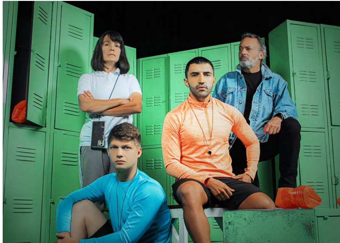
El joven director prefiere propuestas que muevan al público