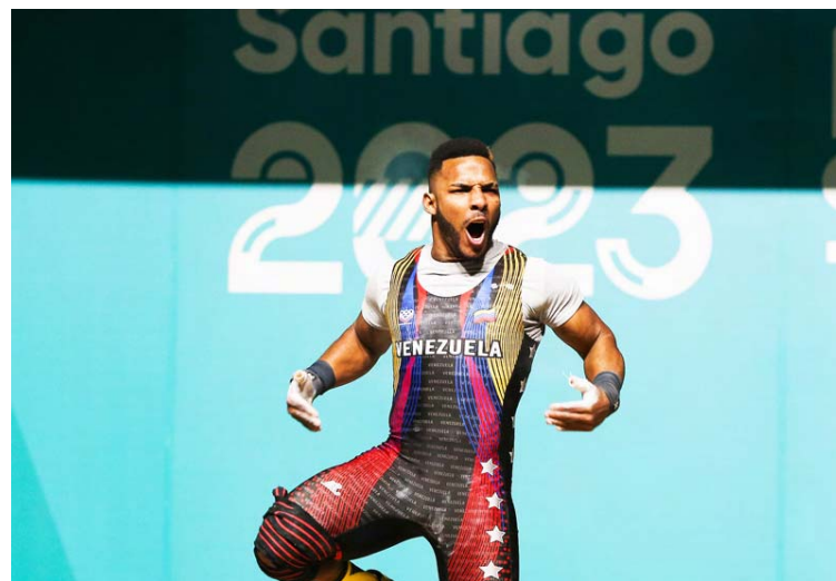
Mayora va por otro podio en tierras francesas

“También a esa edad practiqué boxeo, pero a los dos meses me cansé de recibir coñazos en la cara y me fueran a desfigurar (risas). También a los quince años practiqué futbolito. Era bueno a la defensa y al ataque. Tenía potente patada a la derecha e inclusive espichaba pelotas cuando chutaba. Sin embargo, no tuve la oportunidad de que un cazatalentos me encauzara en la práctica más organizada.