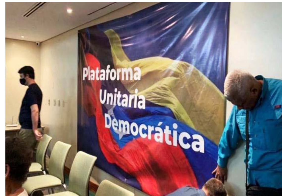
El clima de confrontación entre algunos dirigentes de la oposición venezolana recrudece

La PUD se rige por un sistema de mayoría y consenso, siendo la mayoría de ocho de 10 partidos que conforman la instancia. Independientemente de que el G3 represente las organizaciones más relevantes, pequeños partidos como Causa R de Andrés Velásquez, y Alianza Bravo Pueblo (ABP) de Antonio Ledezma —organizaciones prácticamente extintas del cuadro político nacional— están incidiendo en las decisiones por su alineación con Machado, aunque ella no forme parte de la PUD. De facto,