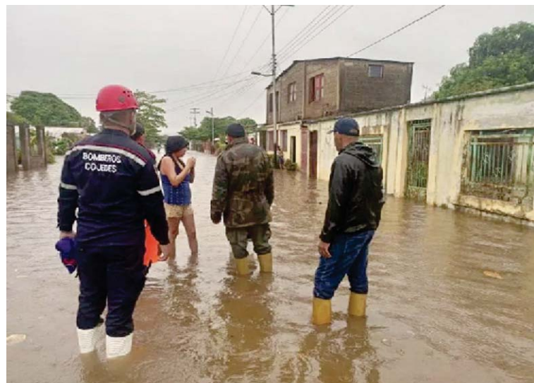
Varios sectores han quedado sin servicio eléctrico debido a la caída de árboles

las etapas de su vida, los diagnósticos tempranos de enfermedades que puedan comprometer la vida y el bienestar de la mujer, así como la creación de nuevos servicios que favorezcan los ciclos de vida y atención social de la mujer.