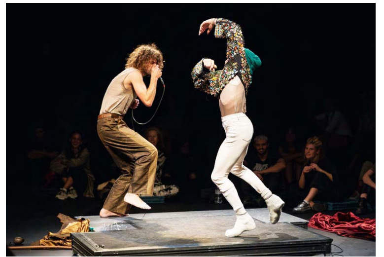
El ensamble de voces FEM acompañó el In Memoriam

En su gira por Latinoamérica que abarca cinco países, Ecuador, Colombia, Venezuela, Bolivia y Argentina, gracias al apoyo del ministerio de la cultura francés y la antena regional América del Sur hispanohablante, coordinada por el Instituto francés de Argentina, el espectáculo se presentará en una única función en el Teatro Teresa Carreño, el día el día viernes, 26 de abril a las 7.00 p. m.