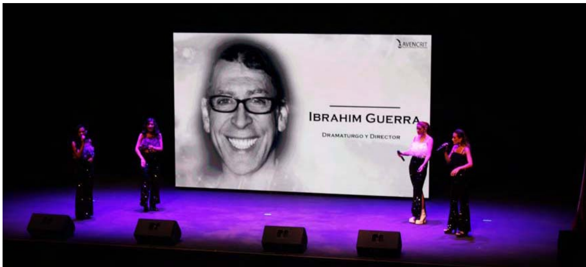
La presentación forma parte de una gira latinoamericana

T/ Redacción CO