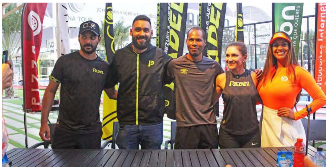
Organizadores explicaron detalles de la justa