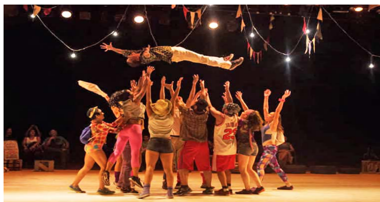
Artistas invitados de Francia darán inicio al evento

El Teatro Teresa Carreño celebrará la Semana de la Danza 2024, para sumarse así a la conmemoración el 29 de abril, designado como Día Internacional de la Danza, instaurado por la Unesco en la fecha aniversaria del nacimiento del bailarín y coreógrafo francés Jean Georges Noverre, maestro reformista de los principios fundamentales de la danza escénica universal. Noverre, influyente personaje en la danza del siglo XVIII, por