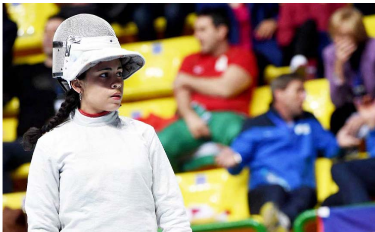
La caraqueña demostró que sí sabe dar sus estocadas

“En la final, con más emoción, con más adrenalina, tenía que estar más enfocada en el trabajo. Y siento que todo lo que venía entrenando, todas las competencias que he hecho, me estaban preparando para este momento, para estar enfocada en este combate. Dar el todo por el todo, luchar desde el corazón. Me sentí muy bien.