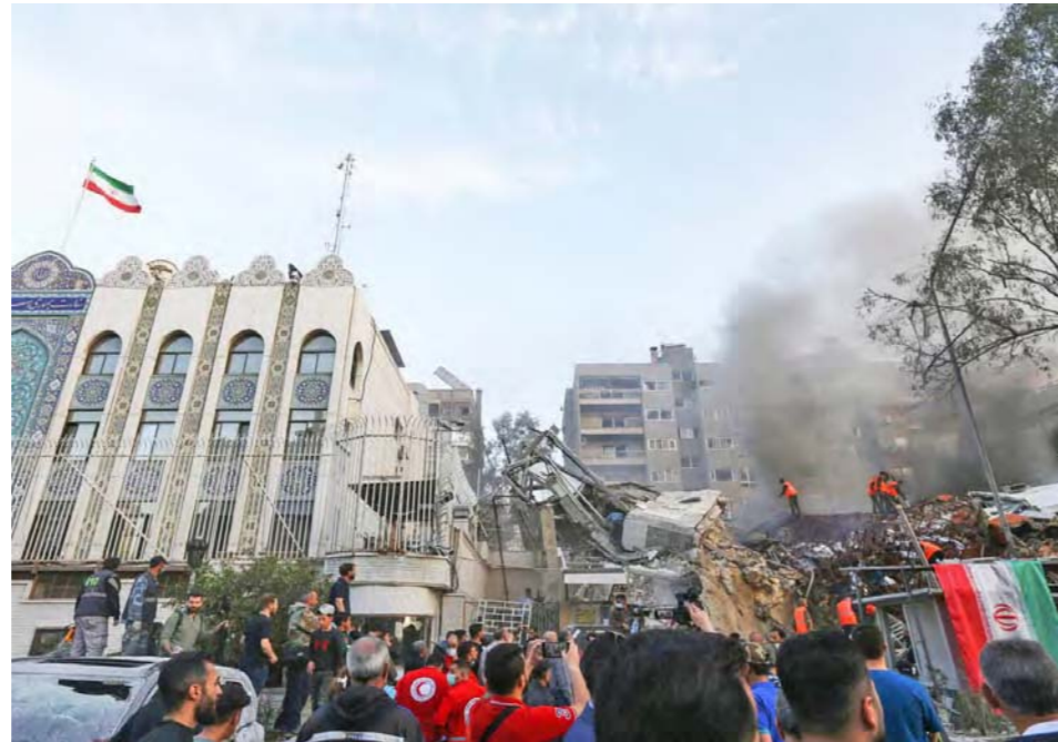
Ataque al consulado iraní en Damasco, capital de Siria

El primero se refiere a la democratización de la ONU, que implicaría una eliminación del veto que poseen los