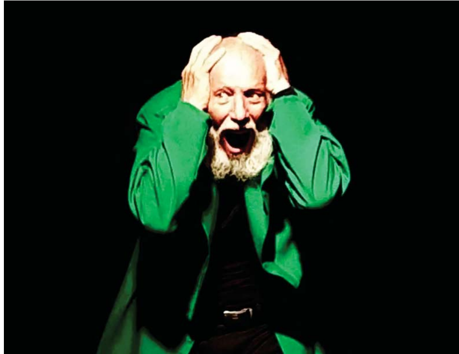
El multipremiado intérprete ya lleva cinco décadas de trayectoria

Justo ahora, recién llega al país después de siete años de ausencia y una de las primeras actividades de su agenda, después de pasar un tiempo con su familia en Lara, es ofrecer el taller Monstruos y miedos en escena, una propuesta que se desarrollará en la Escuela Superior de Artes Escénicas Juana Sujo y para la cual estarán abiertas las inscripciones,