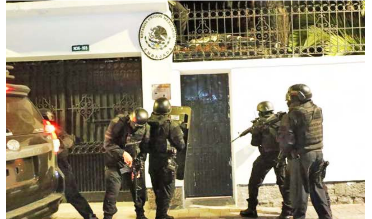
El asalto a la embajada de México realizado por Ecuador el pasado 5 de abril

En Asia Occidental ya estamos asistiendo al escalamiento de las tensiones entre Israel y la República Islámica de Irán producto de la misma inobservancia del Derecho Internacional, lo que