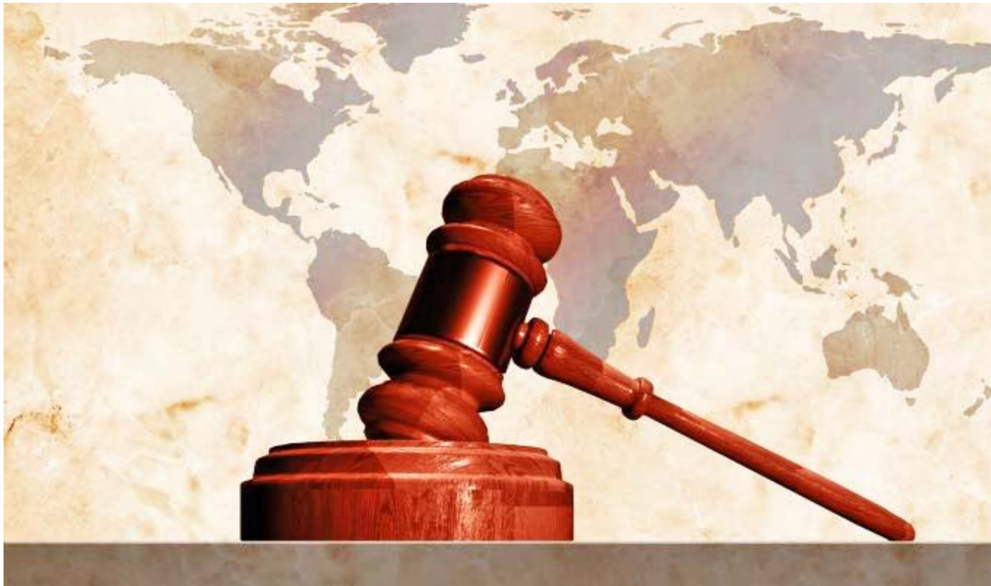
El Derecho Internacional debe ser garantía para evitar que se produzcan nuevos conflictos mundiales

Según ese escenario, la ONU, Estados Unidos y los países de la Unión Europea hacen caso omiso a las exigencias de la comunidad internacional en cuanto poner fin al genocidio israelí sobre el pueblo palestino; se produjo el ataque al consulado iraní en Damasco, capital de Siria, por parte del ejército sionista; y ocurrió el allanamiento de la embajada de México en Quito perpetrado por las fuerzas de seguridad del Estado ecuatoriano, lo que en conjunto suma nuevos elementos, impredecibles e inéditos, que abonan al descrédito al que Occidente está sumergiendo el Derecho Internacional y con lo que instan con más fuerza la urgente refundación del sistema de Naciones Unidas.