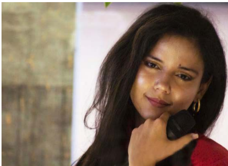
Su estilo lo define como “Piano jazz Venezolano”