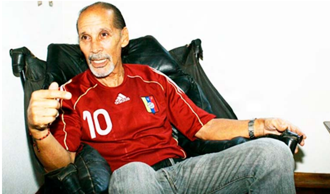
Jugó en una era donde eran escasos los jugadores nacionales

“Mendocita” labró el duro camino de este deporte en una Venezuela sin tradición futbolística. Integró el primer equipo que disputó un clasificatorio a un