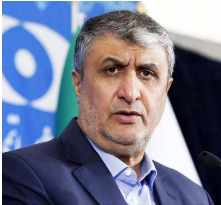
El jefe de la Organización de Energía Atómica de Irán criticó al occidente por privar a países del acceso a radiofármacos

Un acelerador de partículas es una máquina que se utiliza en la radioterapia para tratar a enfermos con cáncer. Esta