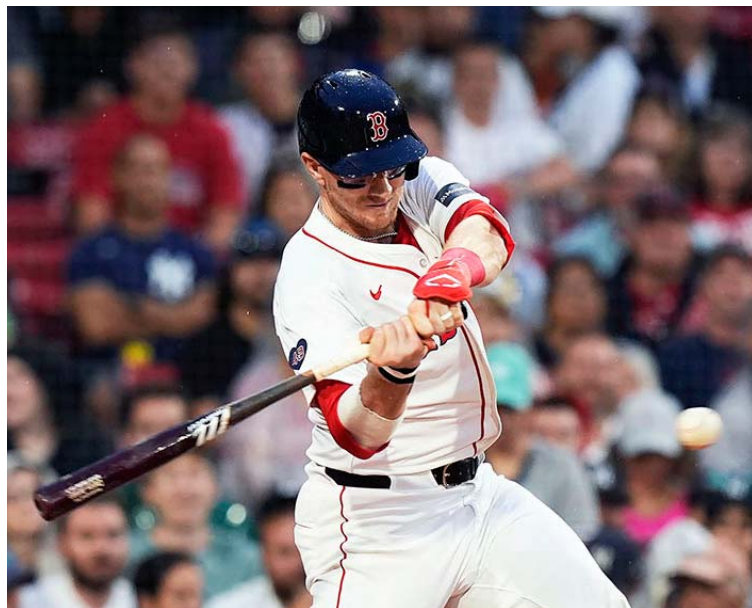
Jansen actualmente está con los "patirrojos"

Aquí es donde todo se pone más interesante. Jansen fue enviado del club canadiense a los Patirrojos el 27 de julio. Por su parte, el receptor de Boston