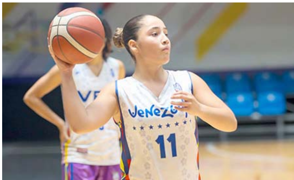
Montero es una piloto de apenas 17 años