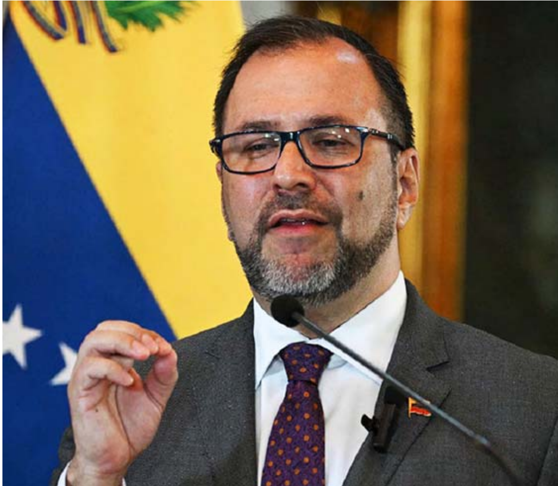
“El Gobierno Bolivariano protegerá a los venezolanos y derrotará las pretensiones de los criminales”, aseveró Yván Gil

Aseguró Gil que los planes desestabilizadores creados por la ultraderecha nacional tendrán una respuesta contundente. “El Gobierno Bolivariano protegerá a los venezolanos y derrotará, nuevamente, las pretensiones de los criminales”, aseveró