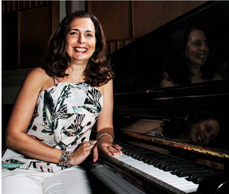
Subirá de nuevo al escenario con cuatro destacados músicos del país