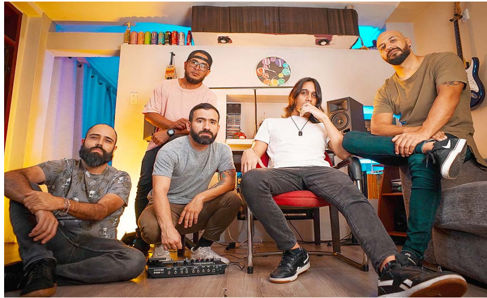
Los cinco integrantes están compenetrados

La inspiración detrás de Nerea en palabras de la banda, surgió en plena pandemia, inspirada en el mar y la mujer, estableciendo una analogía poderosa entre ambos. “El mar es sublime, increíble, hermoso, mágico, misterioso; al mismo tiempo, puede ser muy peligroso y devastador. Una mujer podría tener esas mis-