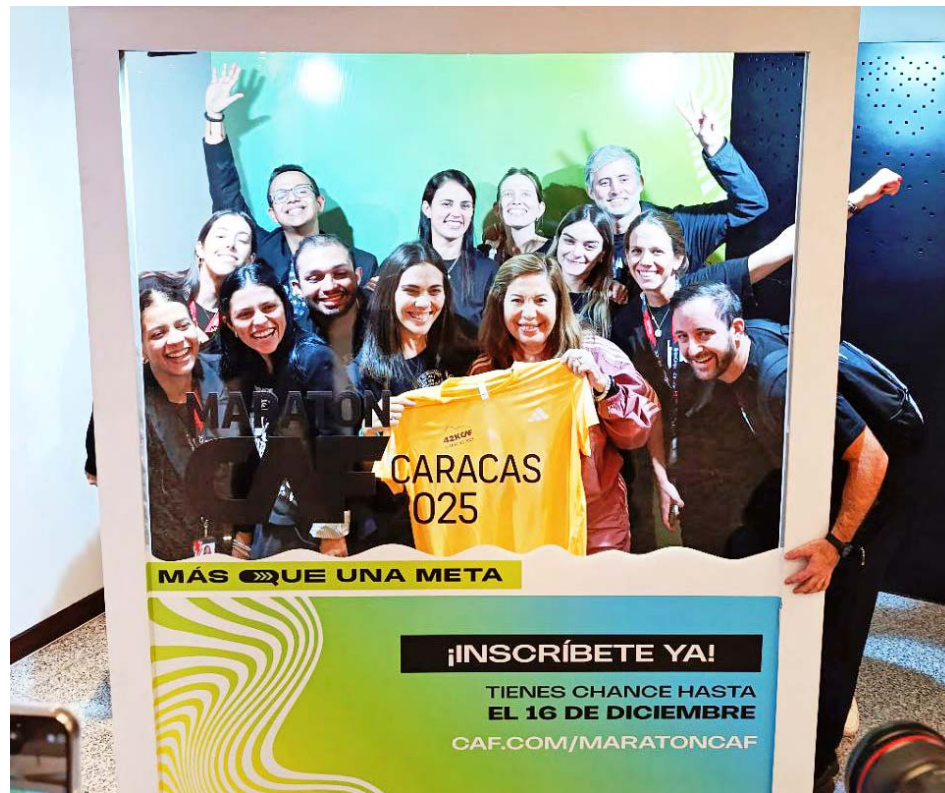
Los organizadores mostraron orgullosos la franela para el año entrante

Reiteró que las y los venezolanos cuentan en el Maratón CAF con una competencia de primer nivel gracias a la confianza depositada por la FVA y las demás federaciones en América Latina y el Caribe en los altos estándares de calidad que tiene la organiza-