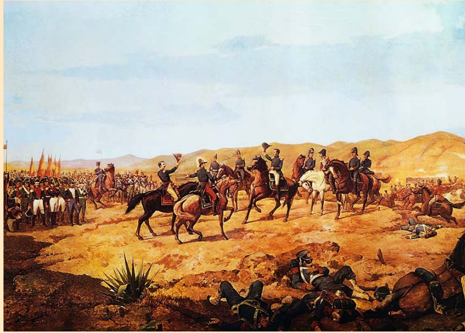
Batalla de Ayacucho por Martín Tovar y Tovar

Por extraño que parezca, ambos comandos estaban convencidos de