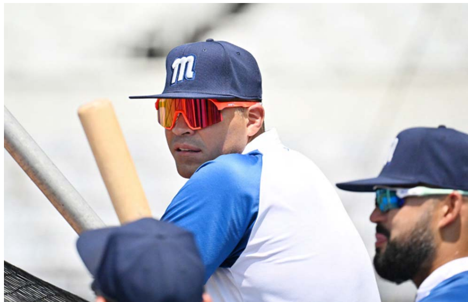
Con cuatro décadas a cuestas tendrá una gran responsabilidad en Baltimore

En este sentido, el nativo de Punto Fijo, fue contactado por la gerencia y el propio mánager de Baltimore, Brandon Hyde, y desde ese momento inició un proceso de entrevistas con cada uno de los departamentos de dicha organización orientadas a la planificación para