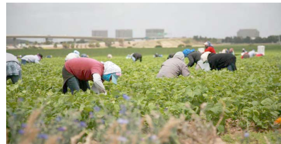
En distintos sectores de la economía estadounidense, la mano de obra migrante tiene una amplia participación

Esta estimación se basa en el análisis de las remesas enviadas a sus países de origen, que en 2022 alcanzaron más de 81.000 millones de dólares, lo que permite inferir indirectamente el valor econó-