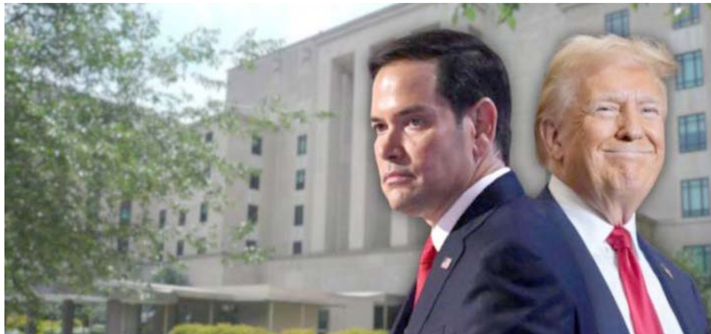
Las empresas petroleras estadounidenses emprenden una ofensiva para evitar revertir el statu quo actual de las sanciones

Se hace cada vez más evidente que se ha articulado un frente de resistencia dentro del sector energético estadounidense que aboga por la continuidad y ampliación del esquema de licencias otorgadas a empresas para operar con Venezuela