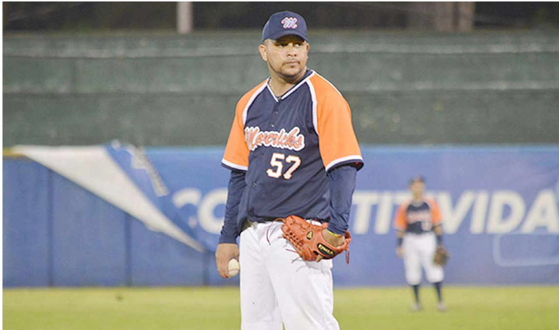
Rondón tiene experiencia en la pelota centroamericana

El Tren del Norte y Leones de León serán los protagonistas