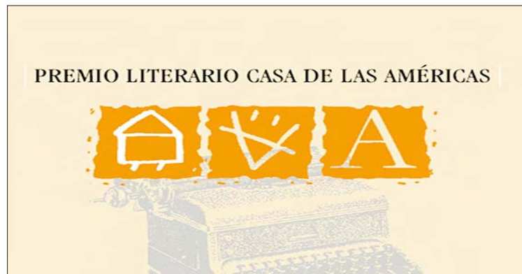
Los ganadores se anunciarán el 25 de abril

El documento advierte que en poesía y cuento solo podrán participar autores latinoamericanos, naturales o naturalizados.