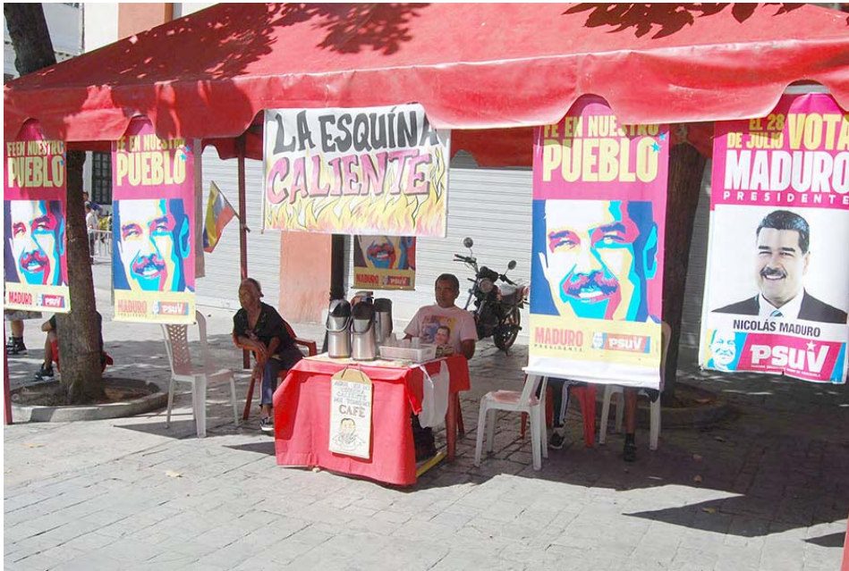
La esquina Caliente