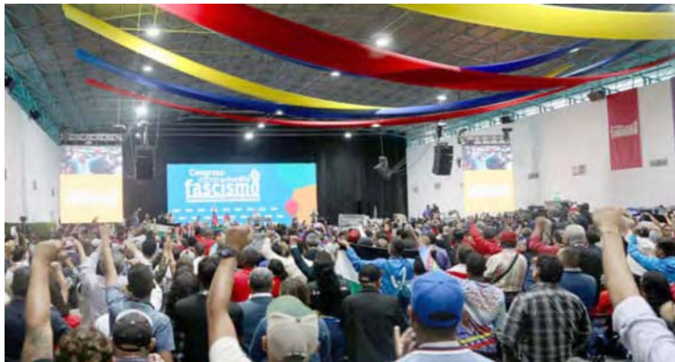
Internacional de Colombia, Costa Rica y Perú expresaron su apoyo a la Revolución Bolivariana

Al respecto, los miembros de la Internacional, capítulo Colombia, conformado por diversas organizaciones sociales, partidos, movimientos, sindi-