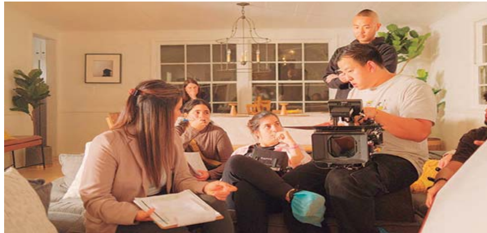
La caraqueña de apenas 31 años también es novelista

T/ Redacción CO F/ Cortesía B. C Caracas