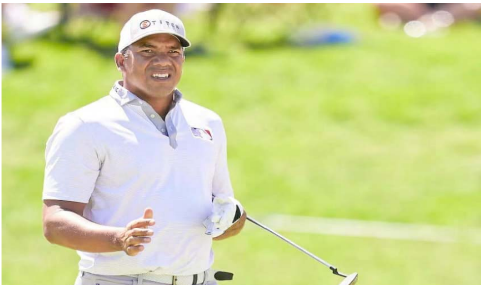
El oriundo de Maturín tiene 40 años

Asimismo, el criollo se lució con su mejor score, anotó ocho birdies y logró posicionarse en el top 5 de Hawái, durante la tercera fecha del torneo, que reunió grandes bastonistas de todo el orbe.