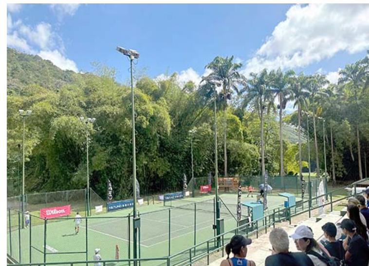
El tenis de élite vuelve a Caracas

Agradeció el apoyo de empresas privadas por apoyar el desarrollo de este evento que busca seguir impulsando el te-