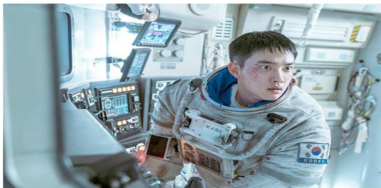
El guion y la dirección son de Kim Yong Hwa

Según la nota de prensa, esta se trata de “una aventura en la cual se funden la innovación tecnológica y la resiliencia humana ante adversidades extre-