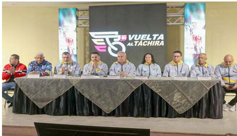
Los organizadores explicaron detalles de la cita pedalística

Por otro lado, el gobernador del estado Táchira, Freddy Bernal Rosales, reflejó en su intervención que tiene todo preparado para recibir la caravana multicolor de este renombrado giro. Afirmó que se ha trabajado en el reacondicionamiento de varias vías por donde estará circulando la carrera ciclista más importante