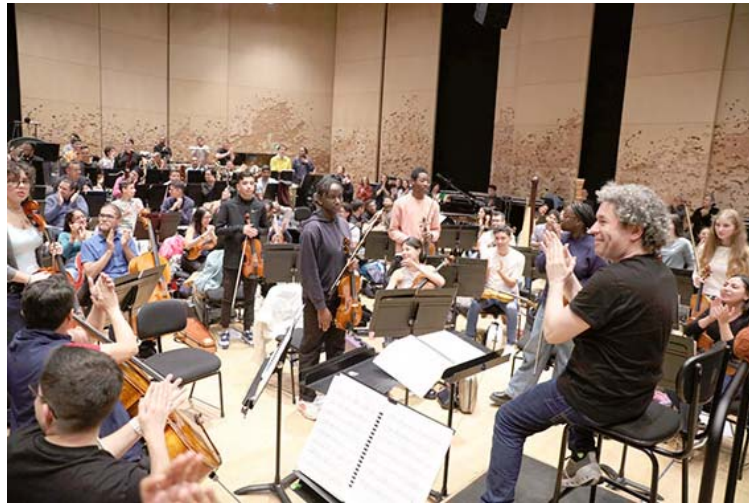
El recorrido busca exponer la calidad técnica e interpretativa de la agrupación venezolana

El maestro Gustavo Dudamel, director de la Orquesta Sinfónica Simón Bolívar de Venezuela (Ossbv), está a la cabeza de los músicos que tocarán este mes por París, Londres, Luxemburgo, Berlín, Múnich, Bruselas y Madrid, para desarrollar una programación preparada para dar