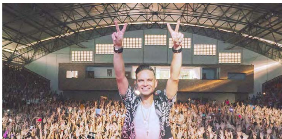
También tiene prevista una gira internacional

El año pasado también realizaron Amigos Tour , en la que Acedo y Buena