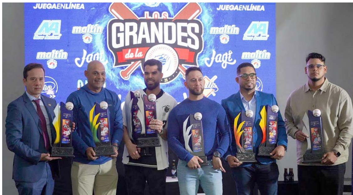
Los ganadores posaron orgullosos luego de una fructífera temporada