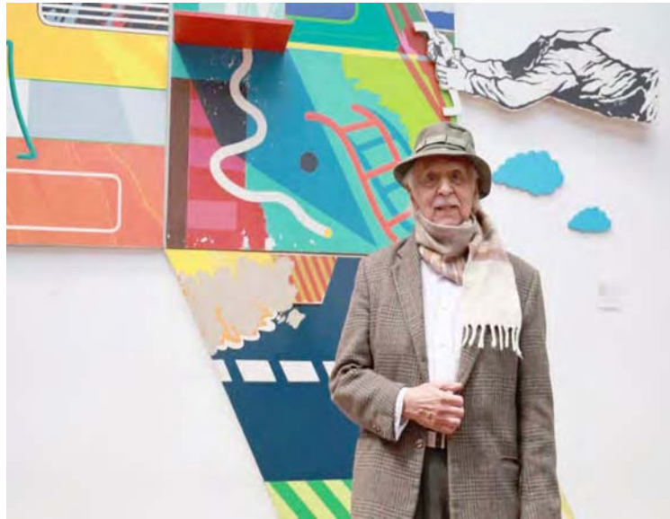
El creador visual expresa en su obra el amor por nuestro país

Durante la actividad el titular de la cartera cultural hizo referencia a la capacidad del maestro nonagenario para acercarse a las realidades de la Venezuela profunda y un empeño por bus-