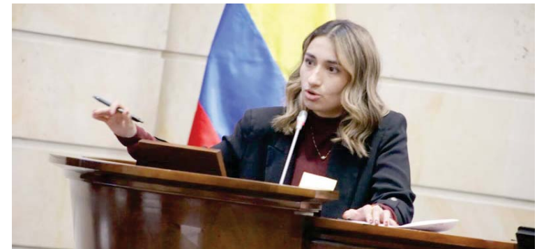
Uno de los retos de Sarabia es la complejidad de las relaciones entre Bogotá y Washington

T/ Redacción CO- VTV