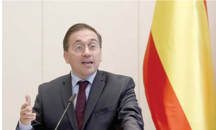
“Por lo que trabaja la Unión Europea y España es por lograr un diálogo entre los venezolanos”, dijo el canciller español

En este sentido, Albares expresó que “por lo que trabaja España y por lo que trabaja la