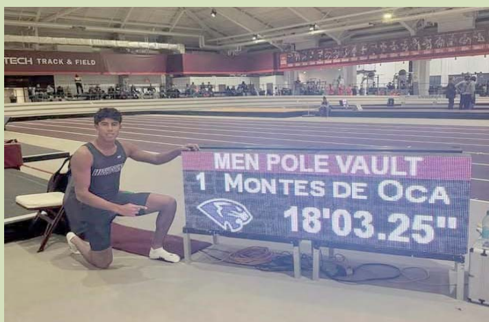
El larense apenas tiene 18 años