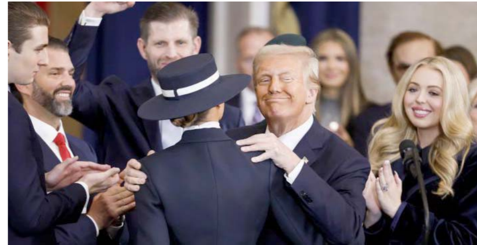
Donald Trump durante el día de inauguración de su vuelta a la Casa Blanca, este lunes 20 de enero de 2025