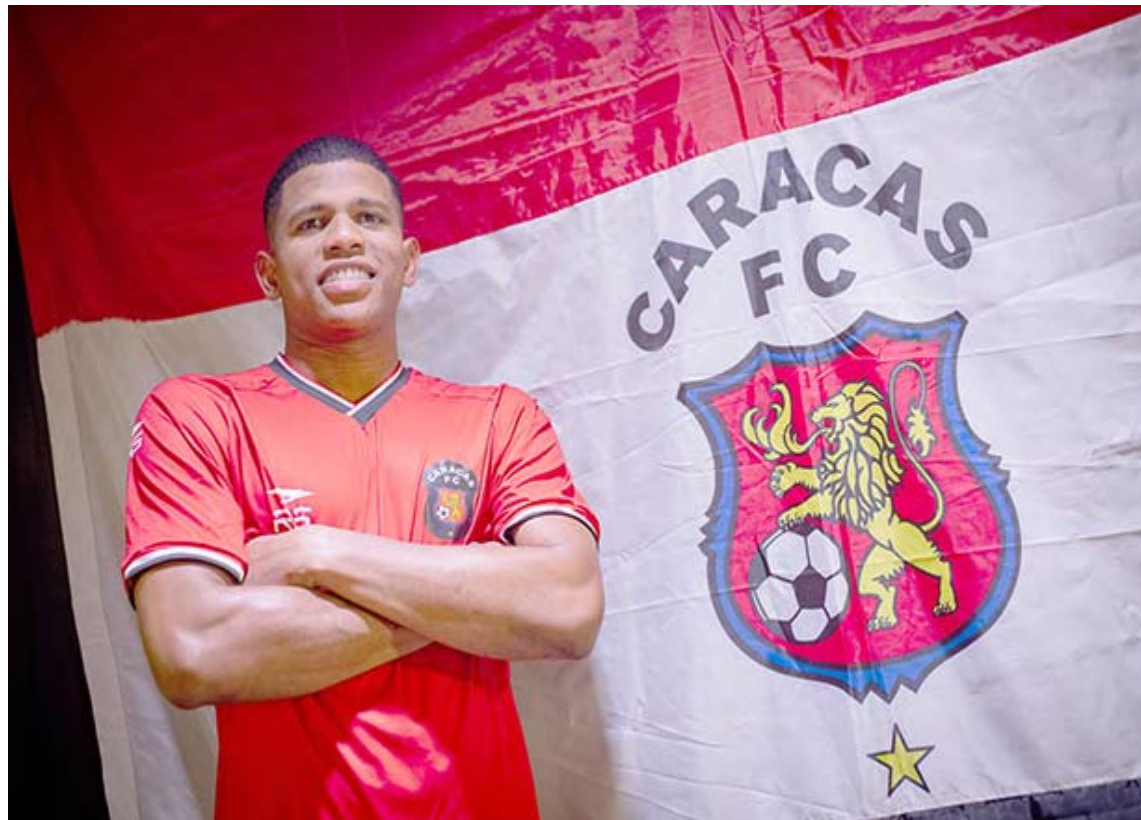
Con casi 29 años, el merideño vuelve al balompié nacional

Tiene experiencia en las ligas estadounidense y colombiana