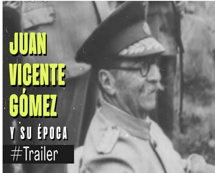
Se proyectará el filme Juan Vicente Gómez y su época

Igualmente, la programación contempla un homenaje póstumo al destacado realizador y docente, Manuel de Pedro, quien cambió de plano