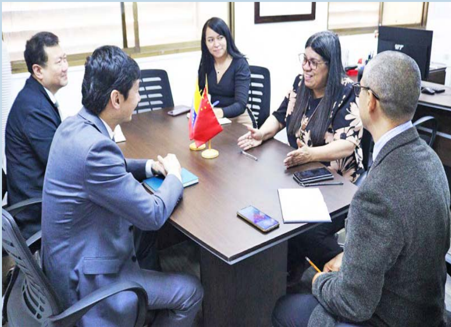
Los diplomáticos abordaron temas de interés internacional

El objetivo de adherir el Plan de las Siete Transformaciones a la política exterior es fortalecer la relación económica entre los dos países y hacer que los métodos adoptados sean efectivos y útiles para el crecimiento mutuo