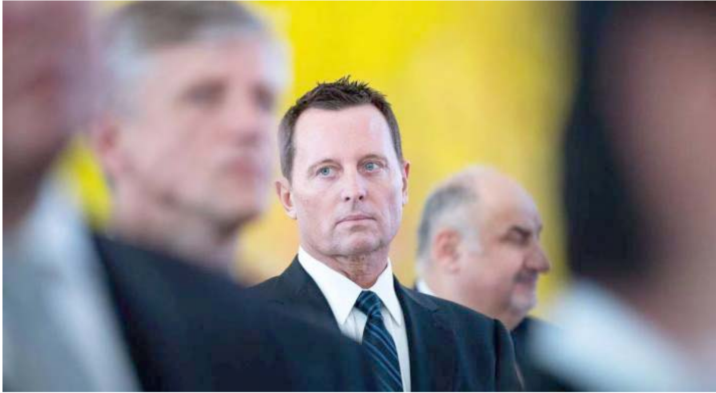
Richard Grenell, el enviado para misiones especiales de Trump 2.0

durante los gobiernos republicanos del siglo XXI, incluido el de George W. Bush.