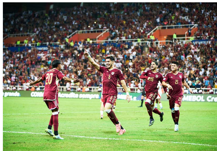
Talento ha mostrado la Sub 20 nacional

Será un duelo que defina el rumbo de esta fase de grupos para la Vinotinto, a la que solo le sirve sumar tres puntos para poder meterse entre las tres primeras del grupo A. Mañana también juegan Uruguay ante Perú.