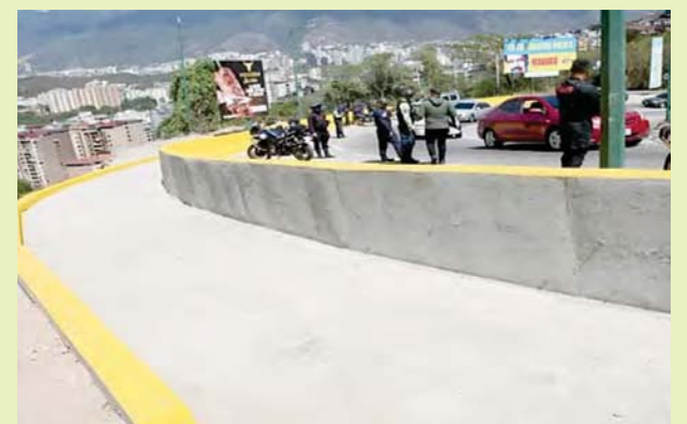
Los trabajos abarcaron los aspectos necesarios para asegurar la durabilidad y funcionalidad de la avenida”, dijo el ministro Ramón Velásquez

La información la suministró el ministro del Poder Popular para el Transporte Terrestre, Ramón Velásquez Araguayán, quien enfatizó que la afectación fue recibida mediante el 1x10 del Buen Gobierno y luego el equipo técnico se desplegó en el sector y comenzó los trabajos de inmediato. Explicó que, en un plazo de tres meses, se construyó un torrente de más