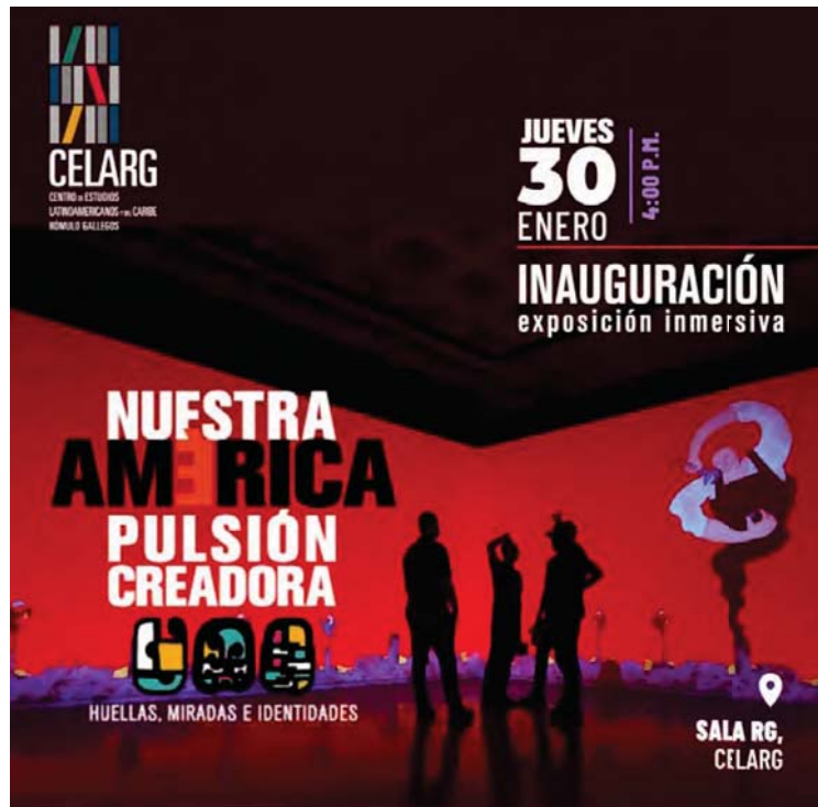
La exposición se podrá visitar de martes a viernes con entrada gratuita