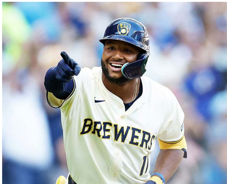
Chourio promete otro gran torneo este 2025

Se trata de algo notable. Primero, Chourio es uno de apenas diez jugadores de Grandes Ligas proyectados para al menos una campaña 25-25, lo que lo coloca