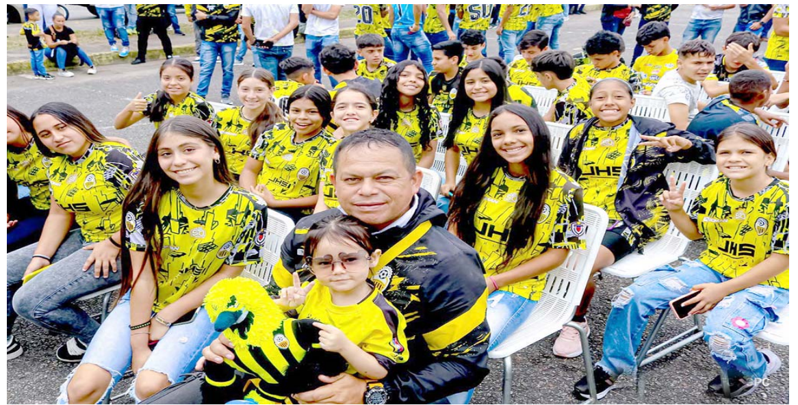
La juventud futbolística tiene una gran alternativa