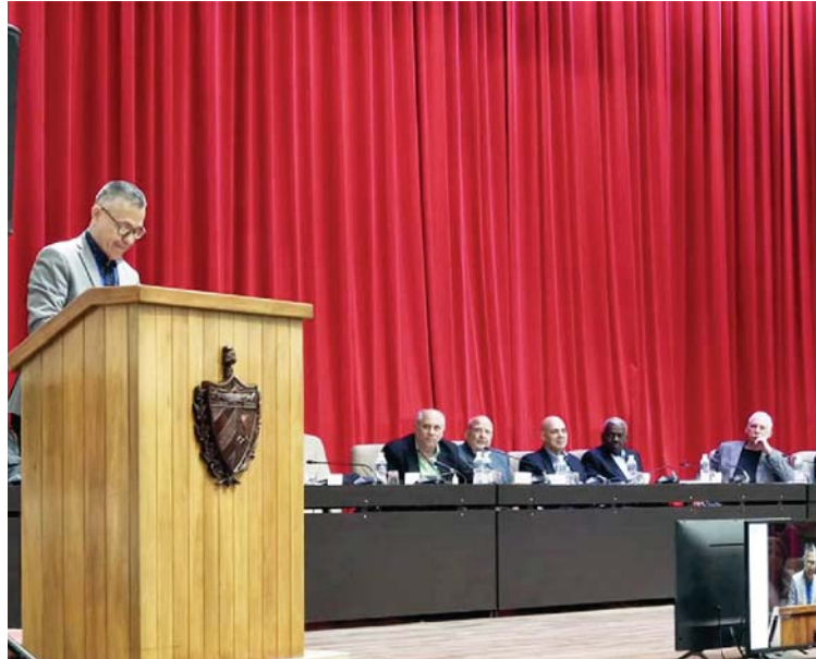
La tierra de Bolívar apuesta a la diversidad cultural como antídoto a flagelos actuales

“Todos los seres humanos somos exactamente iguales,