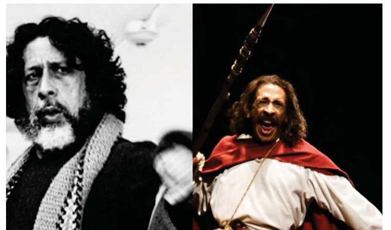
Un total de 10 agrupaciones participan en esta fiesta de las artes escénicas

En la celebración participarán 10 agrupaciones que llevarán a las tablas trabajos de creación actoral en homenaje a “los más im-