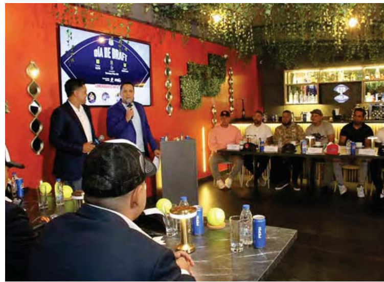
El comité organizador explicó todos los pormenores

Ese día se realizará esta fase con tercero ante cuarto; más primero frente al segundo, con el extra y según las condiciones de campeonato, que el perdedor de la llave 1-2 podrá jugar contra el vence-