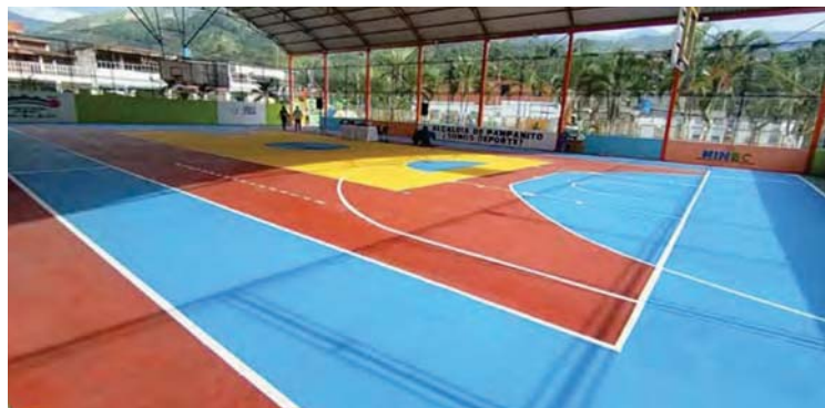
Las instalaciones quedaron de primera línea