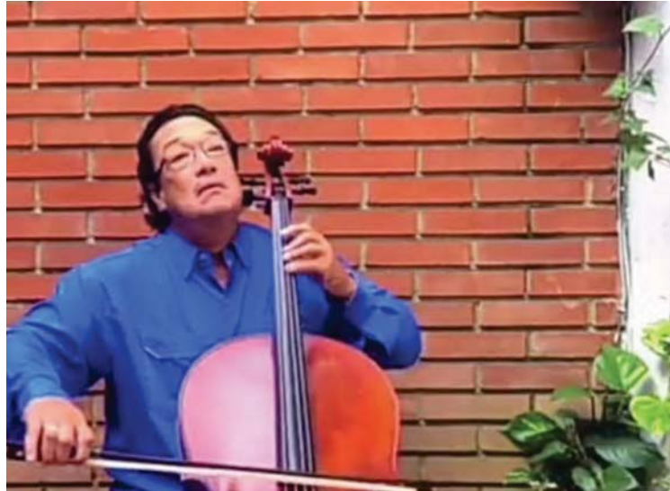
El artista ha formado a varias generaciones de músicos

Claro está que siguió sus estudios en tierras germanas: “A los doce años, en Colonia, la ciudad donde vivía, continué mis estudios musicales. Ya había comenzado con el violonchelo dos años antes en Caracas y terminé mis estudios teóricos en ese país. Viví cuatro años en Alemania y luego fui a Francia a culminar mis estudios de violonchelo”, recordó