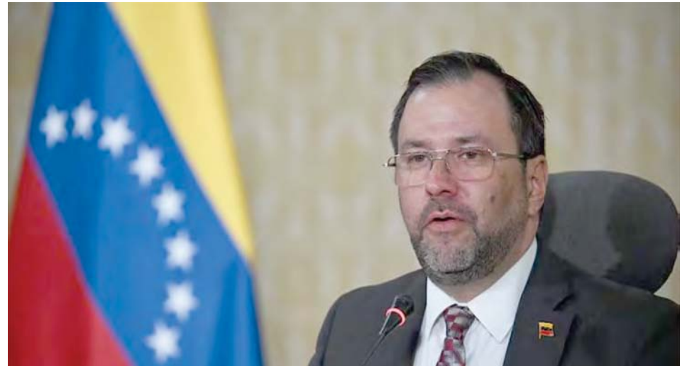
“Ese dinero lo utilizaron para organizar guarimbas, comprar armas”, señaló Yván Gil

En investigaciones recientes que lleva adelante la administración de Donald Trump a la Agencia de los Estados Uni-