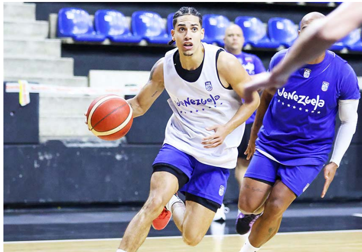
Apenas tiene 23 años este piloto criollo

“Ha sido mi mentalidad desde hace unos ocho o nueve años para acá. Nunca fui el más talentoso, pero sí el que más trabajó. Ese trabajo es el que me ha dado resultado. La ética la mantengo día a día”, resaltó.