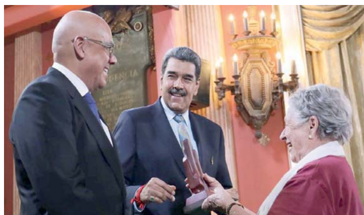
págs. 4 y 5

Comunal, se ajuste a la construcción de la nueva modernidad y se fortalezca el ámbito económico productivo no dependiente del petróleo. Anunció la creación de una Comisión Nacional amplia e incluyente que se encargue del proceso de consulta y elaboración del proyecto final de la Reforma Constitucional.