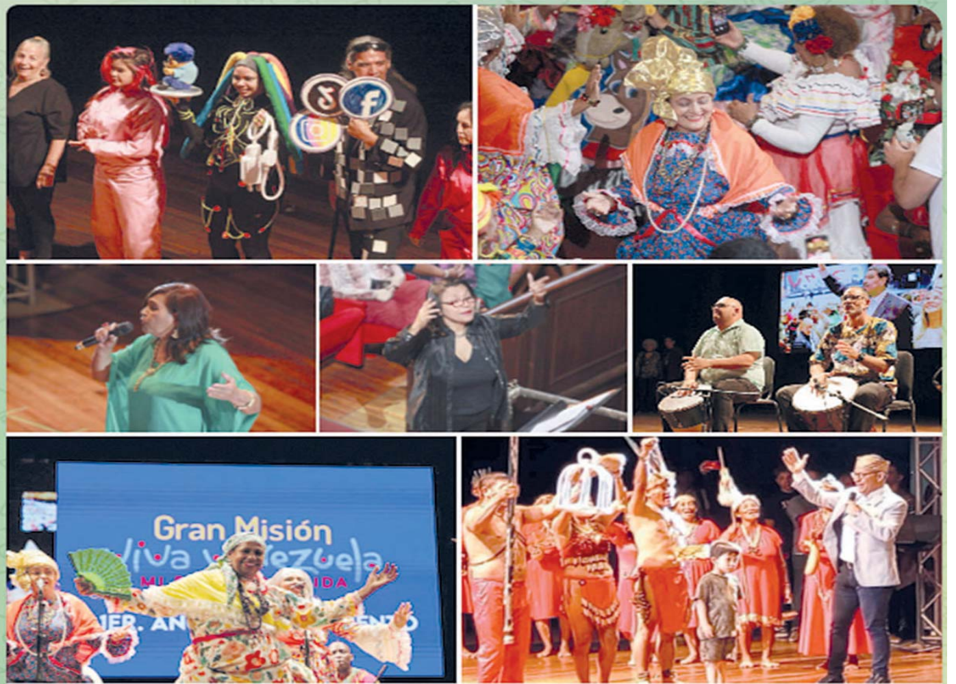
págs. 2, 4 y 16

emblemáticas. El Presidente Nicolás Maduro se incorporó a las actividades del día con un mensaje publicado en Telegram, en el que destaca, entre otras cosas, el trabajo de la Gran Misión Viva Venezuela, Mi Patria Querida en la batalla contra “la desculturización que enfrenta la humanidad, el intento de imponernos un solo pensamiento y de arrebatar nos la memoria”.