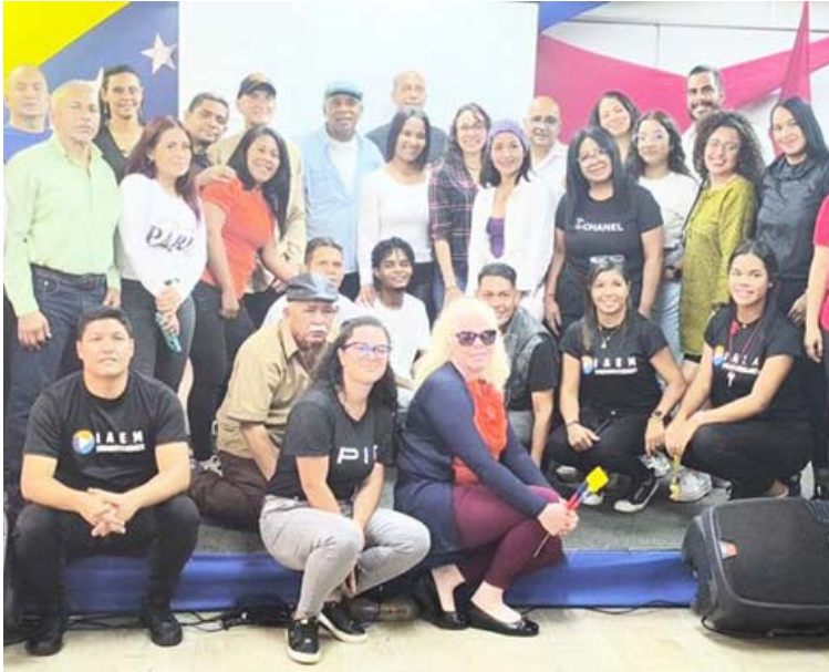
La entidad se crespó en febrero de 2006

Entre sus proyectos para este año se cuentan el Plan Produce; la creación de una revista de formación que tiene por nombre Confluencia Cultural, así como el impulso del Ciclo de Actualización Profesional César Rengifo. Además, está prevista una nueva edición del Diplomado de Gestión y Producción en alianza con la Unearte