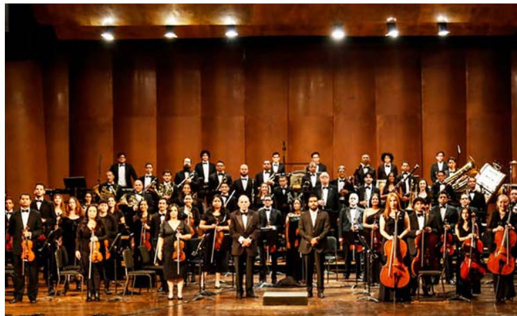
Los asistentes disfrutarán de una presentación inmersiva

Este evento marca un hito en la trayectoria de la orquesta, que a lo largo de estas cuatro décadas y media ha logrado consolidarse como una de las principales formaciones sin-