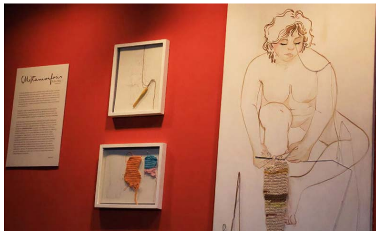
La propuesta combina el crochet con técnicas plásticas clásicas

Díaz detalló que esta obra la retrata, la teje a sí misma, en una especie de viaje que entrelaza tres elementos fundamentales del ser humano: cuerpo, alma y mente. Considera que, a lo largo de la vida, las personas van evolucionando y alcanzando