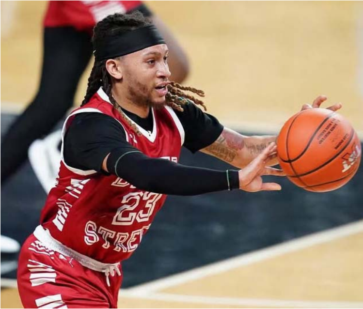
Alani tiene también experiencia en Irán

al equipo. Haré lo que sea necesario para ganar”, citó sin modestias falsas el gringo. En el viejo continente tuvo 15.3 tantos, 3.9 rebotes, 5.5 asistencias, 2.8 robos y 44.4 % en triples, en estos dos últimos departamentos fue segundo en toda la liga. También el oriundo de Washington DC tiene experiencia en Irán, además de haber visto acción con la universidad de Temple en la NCAA división 1. En su pasantía más reciente dejó average de 10.9 puntos, 5.3 asistencias, 1.7 robos y 39 % en triples con Leones de Quilpué en la LNB de Chile. Asimismo, en la Copa Chile promedió 14.4 unidades, 4.1 rebotes, 4.3 pases, 1.3 estafadas, y 38.7 % en disparos desde la larga distancia. Tras lo que será su primera participación en la SPB, el armador estadounidense manifestó sus ansias y deseos de incorporarse al equipo.