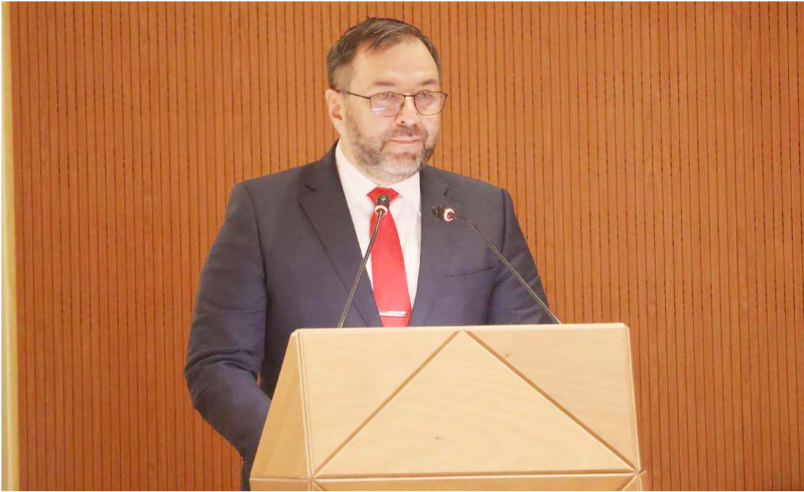
El Canciller Yván Gil denunció como “alarmante” el considerable aumento del gasto mundial en armamento

“Hemos apoyado y seguiremos apoyando todas las iniciativas que promuevan el desarme total y la no proliferación de armas nucleares, por considerar que su existencia es una negación de la vida y de la dignidad humana”, recalcó el Canciller en el foro multilateral, que se celebra en paralelo a la jornada inicial del 58° período de sesiones del Consejo de Derechos Hu-