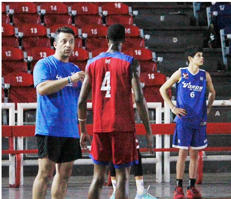
Los astados quieren tener sus piezas en el mejor estado físico