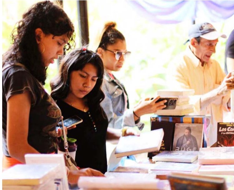
La rumba de las letras continúa su recorrido por el país

Se programaron presentaciones de libros, incluyendo novedades editadas por los sello estatales El Perro y la Rana, Monte