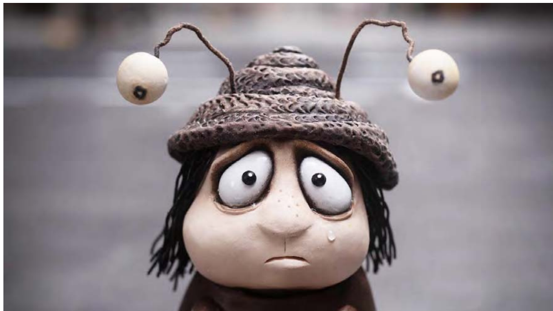
“La vida es un tapiz hermoso que necesita ser experimentado”. Grace Pudel

Las autoridades cinematográficas venezolanas la clasificaron como clase B, para mayores de 12 años y esta vez no se les fue la mano, Memorias de un caracol no es un animado para niños, pero quizás todos los padres deberían verla. Entre sus componente se consigue violencia, maltrato, alcohol, galletas de marihuana, dedos rotos y amputados, la muerte de un padre frente a sus hijos, incendios provocados, terapia de electroshocks para “curar la homosexualidad”, intentos de suicidio, sexo, un juez que se masturba en público, lenguaje soez, etcétera.