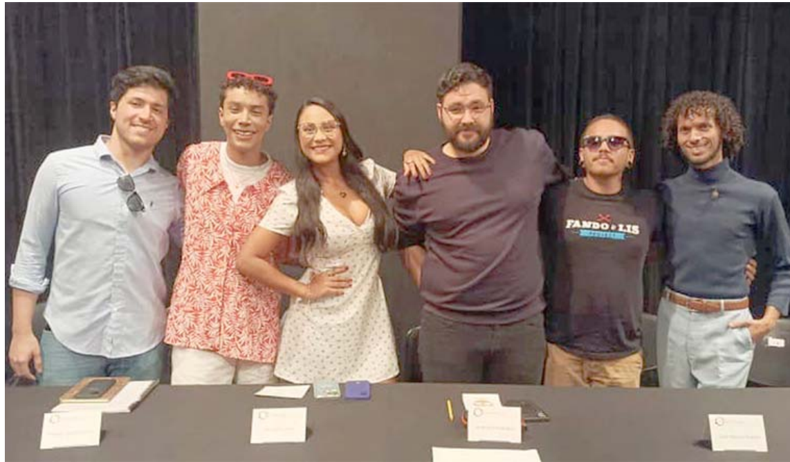
Será la única dama que rete a cinco caballeros para ganar este certamen

“Esta obra la escogí porque desde muy niña la vi y es mi