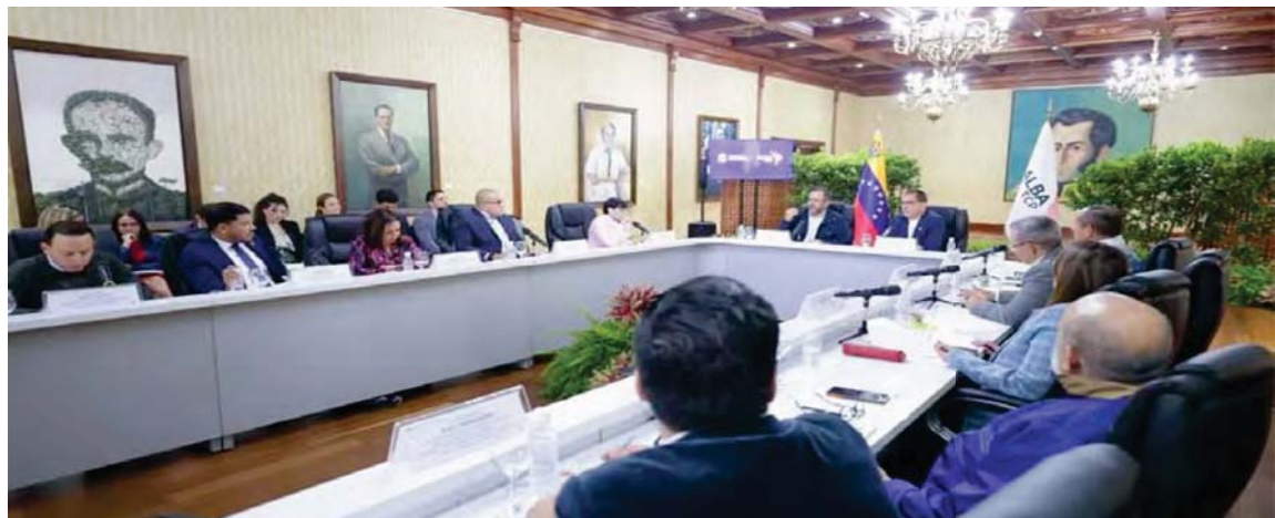
La alianza realizó ayer una reunión preparatoria para la cumbre que se desarrollará este año en Caracas

También “se discutió la facilitación del comercio Intra-ALBA y el Proyecto AgroAlba, diseñando