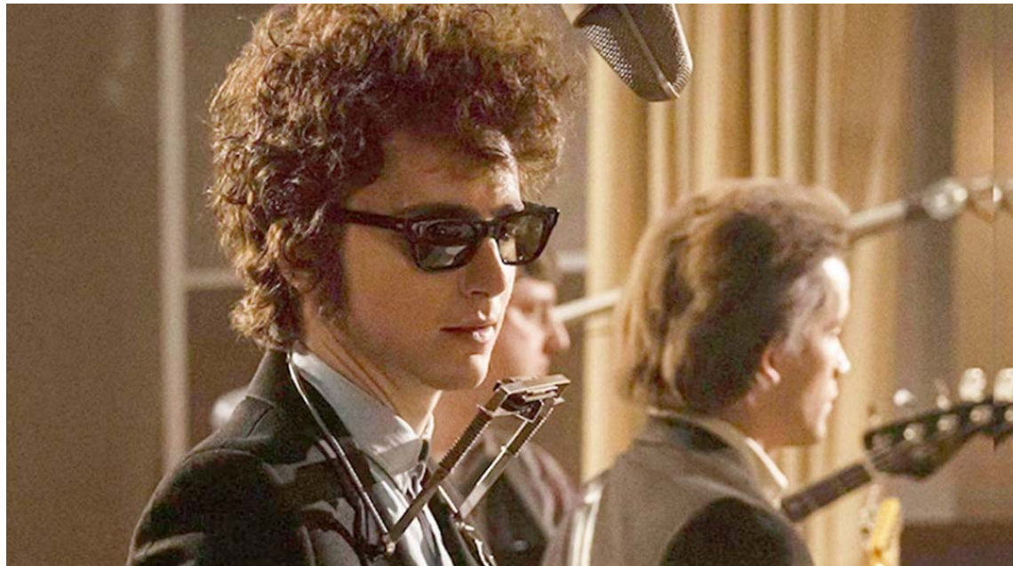
Timothée Chalamet logra capturar la esencia del legendario cantautor