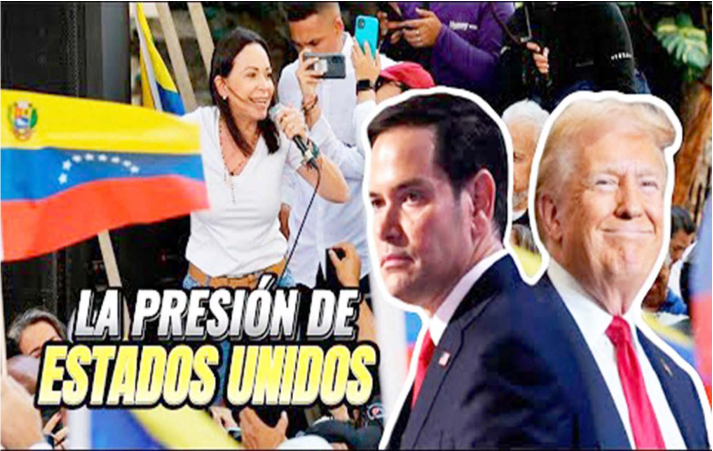
María Corina Machado presiona para tener la atención de la Casa Blanca

Coincidiendo con la publicación del artículo, el Secretario de Estado reiteró su discurso sobre Venezuela como una supuesta “amenaza regional”. En un comunicado oficial felicitó al nuevo secretario general de la Organiza-