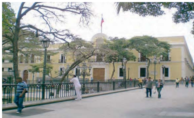
La casa Amarilla, sede de la Cancillería venezolana