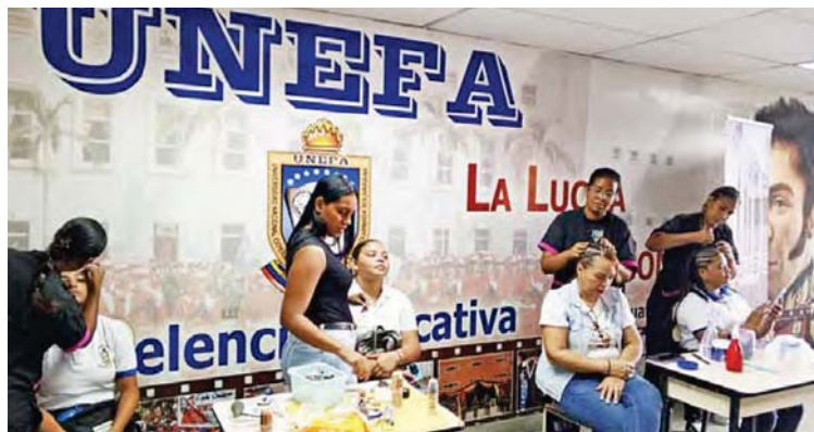
El despliegue permitió informar a los jóvenes la importancia de los siete vértices de la Misión

La actividad tiene como objetivo impulsar un programa social para fortalecer el conocimiento de los jóvenes entre 18