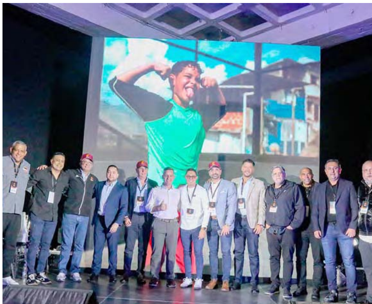
Directivos, entrenadores y aliados de la SPB posaron con mucho optimismo