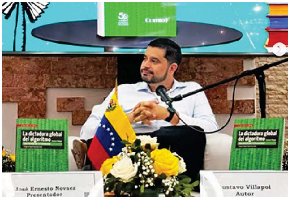
El tema del libro de Gustavo Villapol compete a todas las personas que hacen uso de las plataformas digitales

Este libro, que desenmascara la mercantilización de la información y el control de los algoritmos sobre la sociedad, ha sido el más vendido en la II Feria Internacional del Libro del Sindicato de Trabajadores de la UNAM (FIL STU- NAM) 2025 en México, y su presentación en la 33ª Feria Internacional del Libro de La Habana contó con la presencia de destacados intelectuales cubanos que reconocieron la profundidad y urgencia del tema. Ahora, la pregunta es: ¿Los