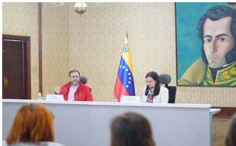
“Tenemos que tener un vínculo entre las instituciones del Estado y los movimientos sociales” dijo el Canciller Yván Gil

Además, se conformarán los Comités Simón Bolívar, anunció Blanca Eekhout ISB creará Consejo Articulador de Movimientos Sociales y Comunas