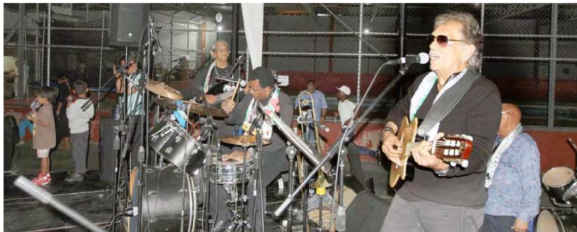
La agrupación Los Guaraguao acaba de recibir un reconocimiento en Honduras