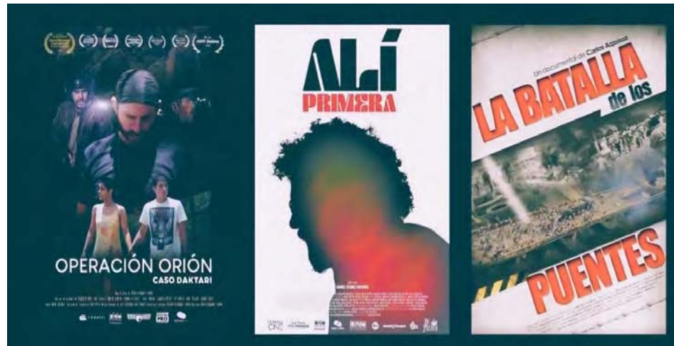
El filme Alí , es uno de los títulos seleccionados para esta exhibición