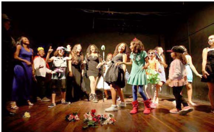
La institución es la más antigua del país en la enseñanza de las artes escénicas