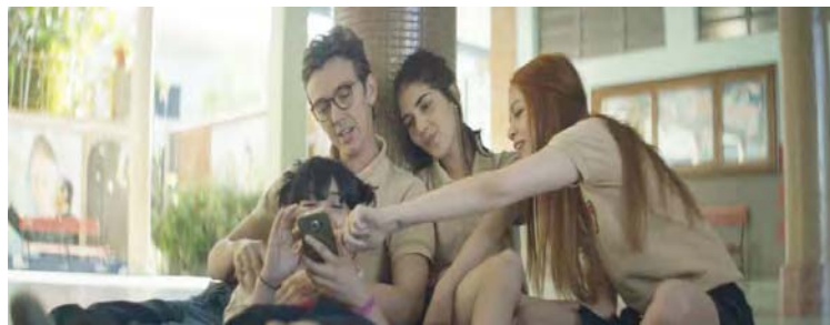
Un filme inspirado en una obra de la literatura contemporánea nacional ganó en 2022

Aquellos cineastas interesados en participar en el certamen deberán inscribir sus obras por medio de la plataforma FestHome o por el correo e, ccscriticafilmfest@gmail.com. La invitación está abierta para los realizadores de cualquier