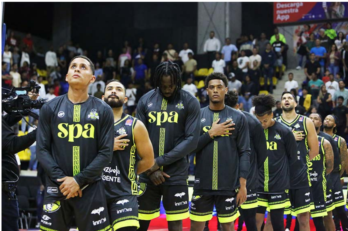
Buen juego colectivo presentó Spartans DC en su primer examen

Los ganadores sin embargo deberán superar fallas en los rebotes