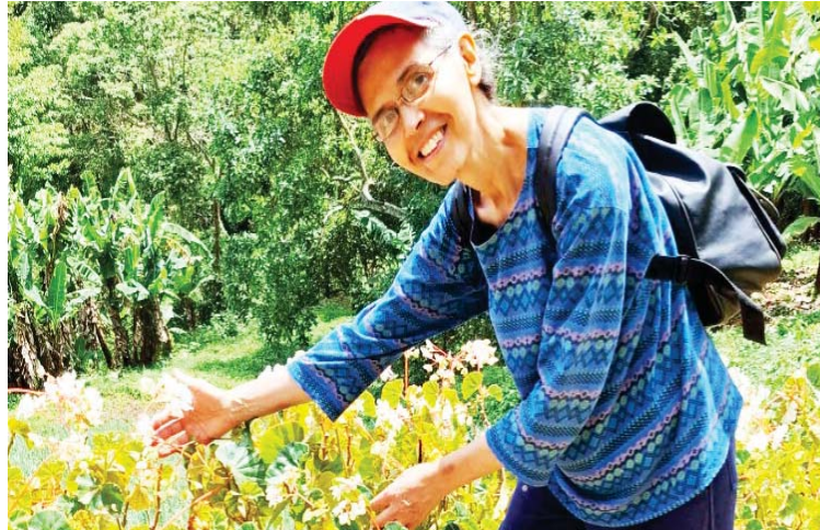
La caraqueña es una senderista y montañista que lleva 11 libros publicados

- Si, en este poemario expreso mis emociones hacia la naturaleza y al ambiente que nos rodea, en una forma detallada y profunda para hacer conciencia en la humanidad. Desde joven, tanto en mis obras pictóricas como en mis obras literarias y