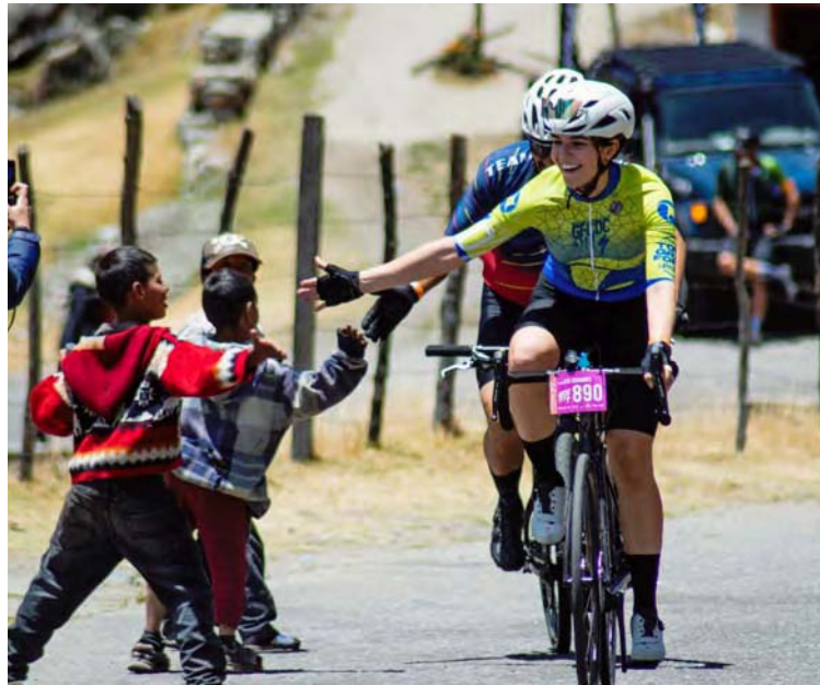
Se espera que más de mil competidores estén en la justa

En pocas palabras, ese cuarteto que pase la raya ga-