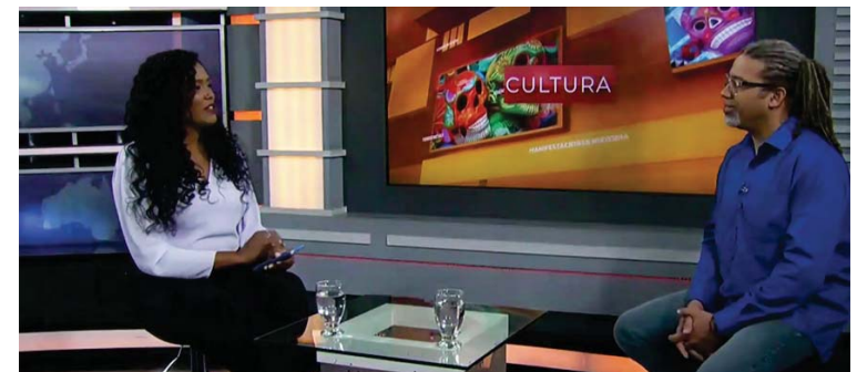
El titular de la FCN manifestó la posición institucional durante una entrevista en Telesur

El principal representante de la institución adscrita al ministerio para la Cultura, expresó su confianza en que el público español y europeo mostrará interés por conocer estas obras cinematográficas, y advirtió que la censura evidencia el avance de “corrientes fascistas en Europa”, comparando la situación actual con el contexto posterior a la victoria contra el nazismo hace 80 años.