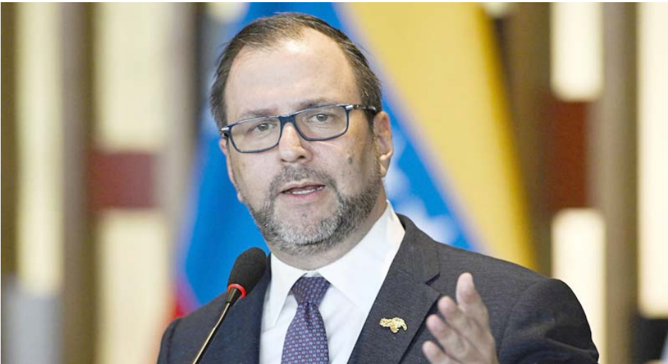
El Ejecutivo Nacional reitera su repudio a las acciones violentas que asesinan a diario a miles de inocentes en Gaza

El Gobierno Bolivariano reafirma su solidaridad con el Pueblo palestino y