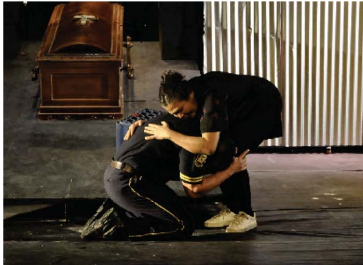
Este fin de semana se realizarán tres presentaciones extra