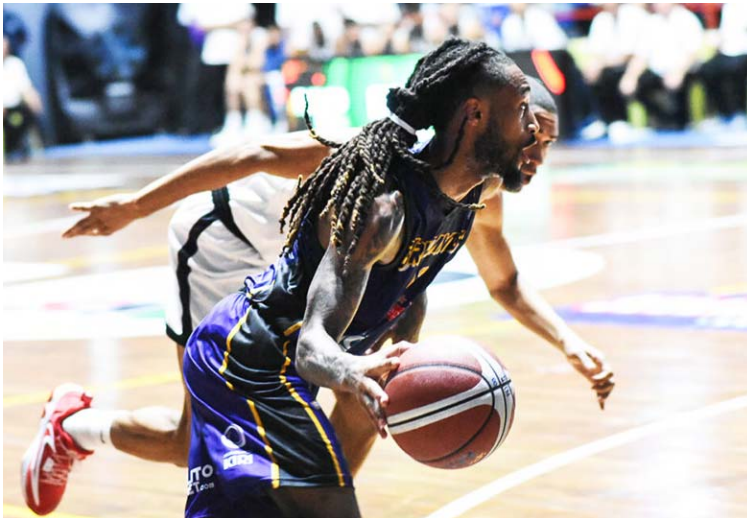
Brillantes no quiere apagarse y va con todo en esta campaña de la SPB

Durante su paso por el Real Estelí, Rice registró un promedio de 14.7 puntos, 7 rebotes y 3.3 asistencias por partido, destacándose por su visión de juego y capacidad ofensiva.