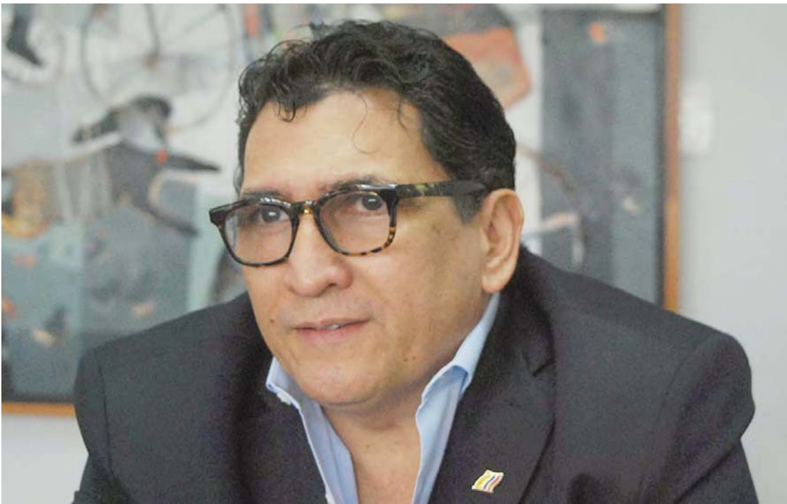
Milton Rengifo, embajador de Colombia en Venezuela

superar ese periodo nefasto, oscuro de las relaciones entre ambos países. Uno entiende que no puede haber unidad en los criterios, no puede haber homogeneidad, sería absurdo una humanidad de pensamiento único. Si bien existieron dificultades, eso se puede superar mediante la diplomacia, pero eso fue una decisión encaminada a aislar a Venezuela. Fue una acción que nosotros condenamos como condenamos las sanciones de Estados Unidos hacia Venezuela porque también afectan a Colombia como país, como también afectan a los dos millones