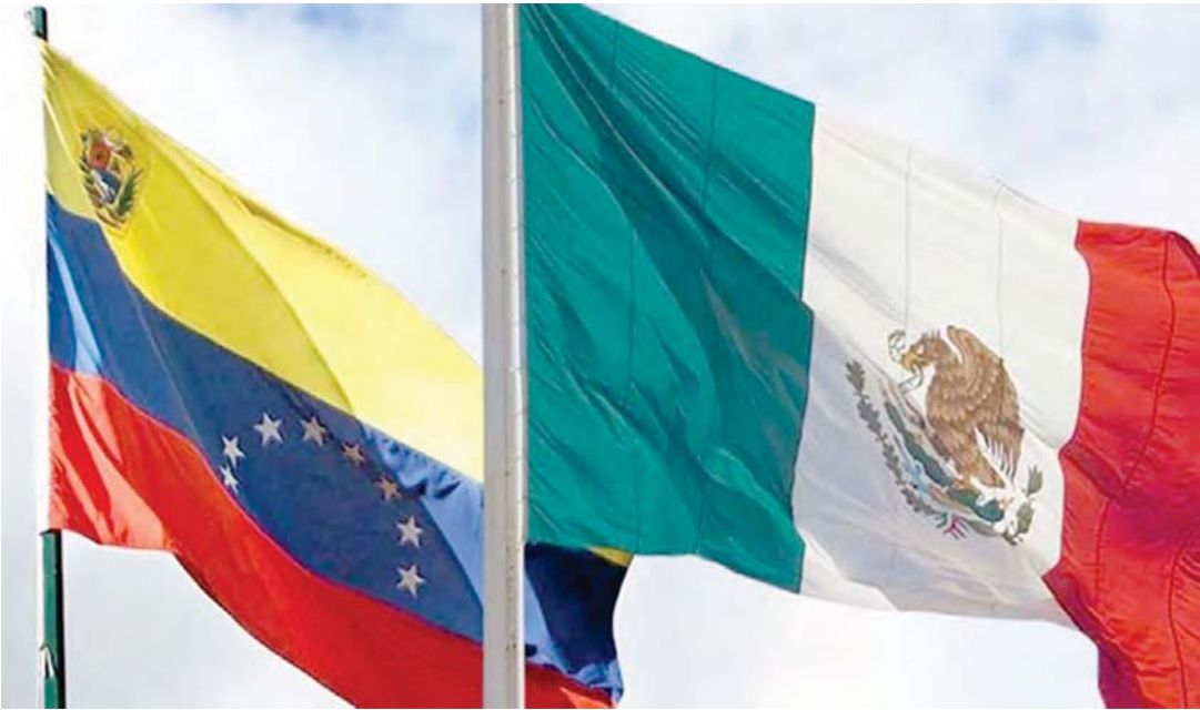
Con su postura Claudia Sheinbaum reafirma la tradición mexicana de neutralidad activa y rechazo a medidas coercitivas

T/ Redacción CO- VTV