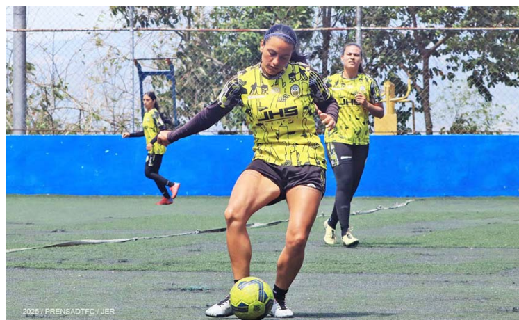
La central está en gran forma en la cancha

La jugadora atigrada que volverá a defender los colores amarillo y negro en el venidero torneo, expresó que trascender y ser campeonas este año, únicamente será posible con el aliento incondicional de la parcialidad tachirense.