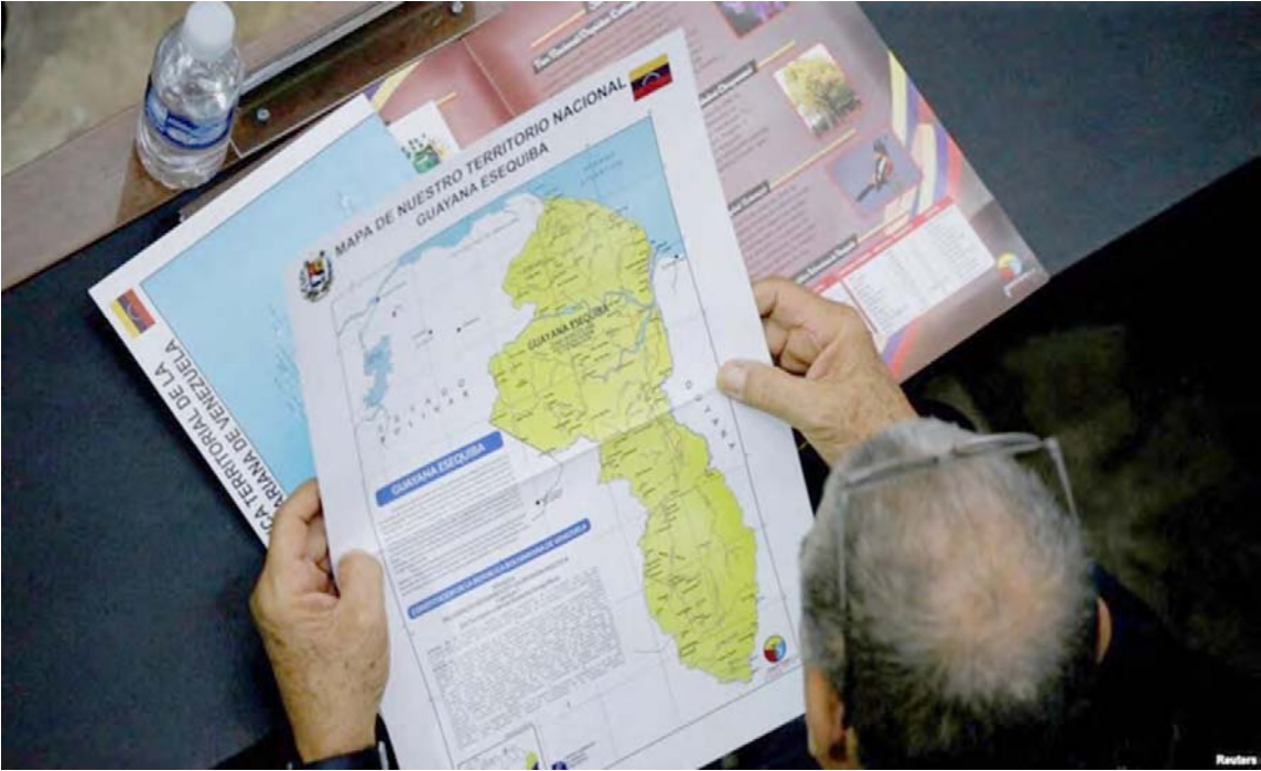
“¡Saque sus narices de esta controversia!”, expresó el Canciller Yván Gil

“Marco Rubio no nos sorprende. Conocemos ese viejo guión de amenazas y bravuconadas con el cual un acomplejado aspira asustar a los pueblos soberanos”, dijo el diplomático venezolano refiriéndose a las declaraciones del funcionario estadounidense quien amenazó con intervenir militarmente en caso de que Venezuela actúe para defender su territorio