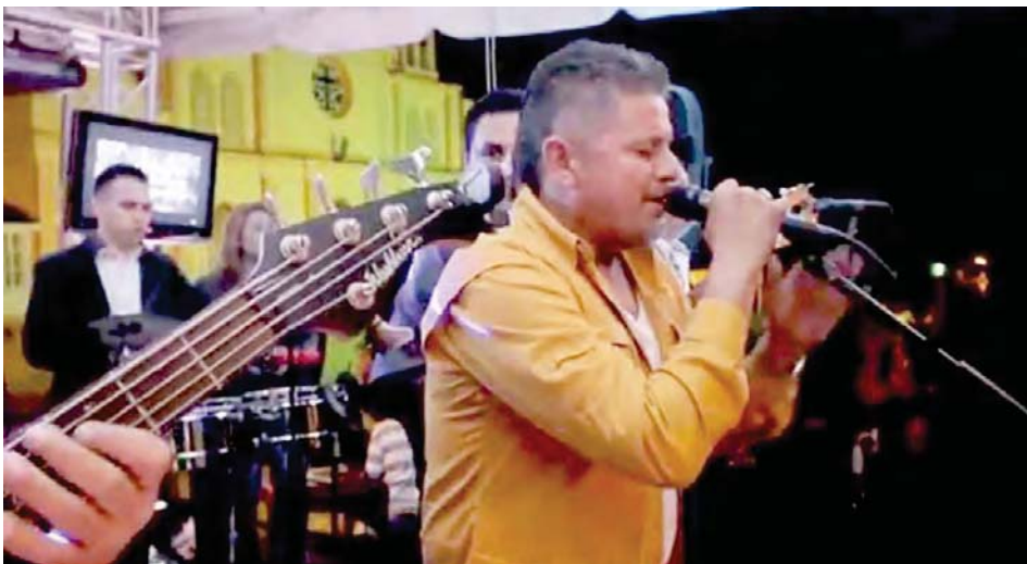
Los Serranitos de América son parte de los atractivos del cartel

T /Eduardo Chapellín