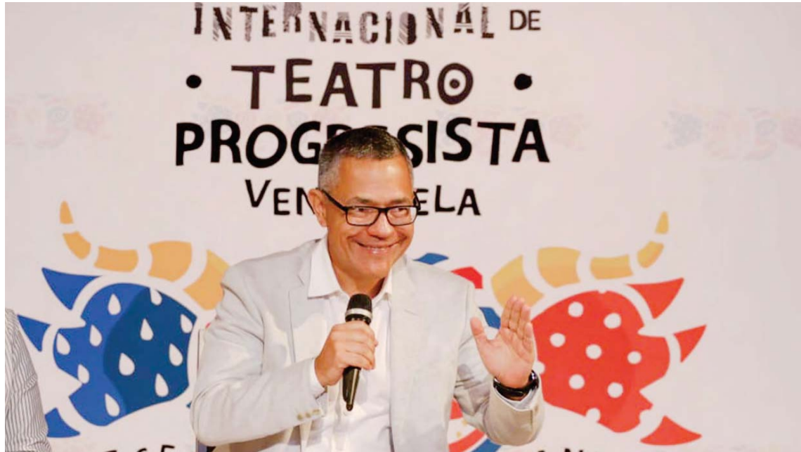
Rusia será el país invitado de honor en esta oportunidad

Un fragmento de La quema de Judas, obra clásica del dramaturgo venezolano Román Chalbaud bajo la dirección de Rufino Dorta, sirvió como preámbulo para anunciar la cuarta edición del Festival Internacional de Teatro Progresista (FITP) Venezuela 2025, que se celebrará del 10 al 20 de abril en 15 estados del país. El evento, presentado este jueves 27 de marzo en la Sala Román Chalbaud del Teatro Alberto de Paz y Mateos, reunirá a 26 compañías internacionales y completará