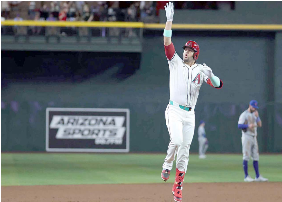
Suárez mejoró su contacto para esta campaña

También Suárez es el segundo venezolano activo con más jonrones con las bases llenas (6), detrás de José Altuve (7), empatado con Wilmer Flores y Salvador Pérez. Entretanto, Suárez elevó a 281 sus cuadrangulares