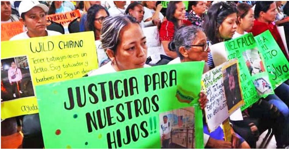
El canciller Yván Gil destacó los esfuerzos que realiza el Ejecutivo para rescatar a los migrantes venezolanos

También denunció que las familias fueron totalmente separadas porque el objetivo era hacer daño y crear cifras inexistentes sobre la migración masiva