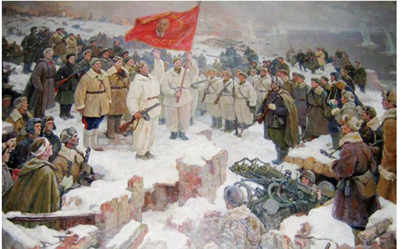
Batalla de Stalingrado.

La permanencia de un momento unipolar era inviable y perjudicial a los intereses de la humanidad. Por ello en 1996 los Gobiernos de Rusia y China firmaron una declaración conjunta en la cual hacían votos por un orden mundial pluricéntrico que estuviera fundamentado en el respeto al derecho internacional, la paz y la integración. Lamentablemente, aquella unipolaridad globalista que se niega a morir, está dando pasos peligrosos para tratar de prolongar sus últimos suspiros, y nuevamente, 80 años después de la Victoria en la Gran Guerra Patria, el mundo esta volviendo a obser-