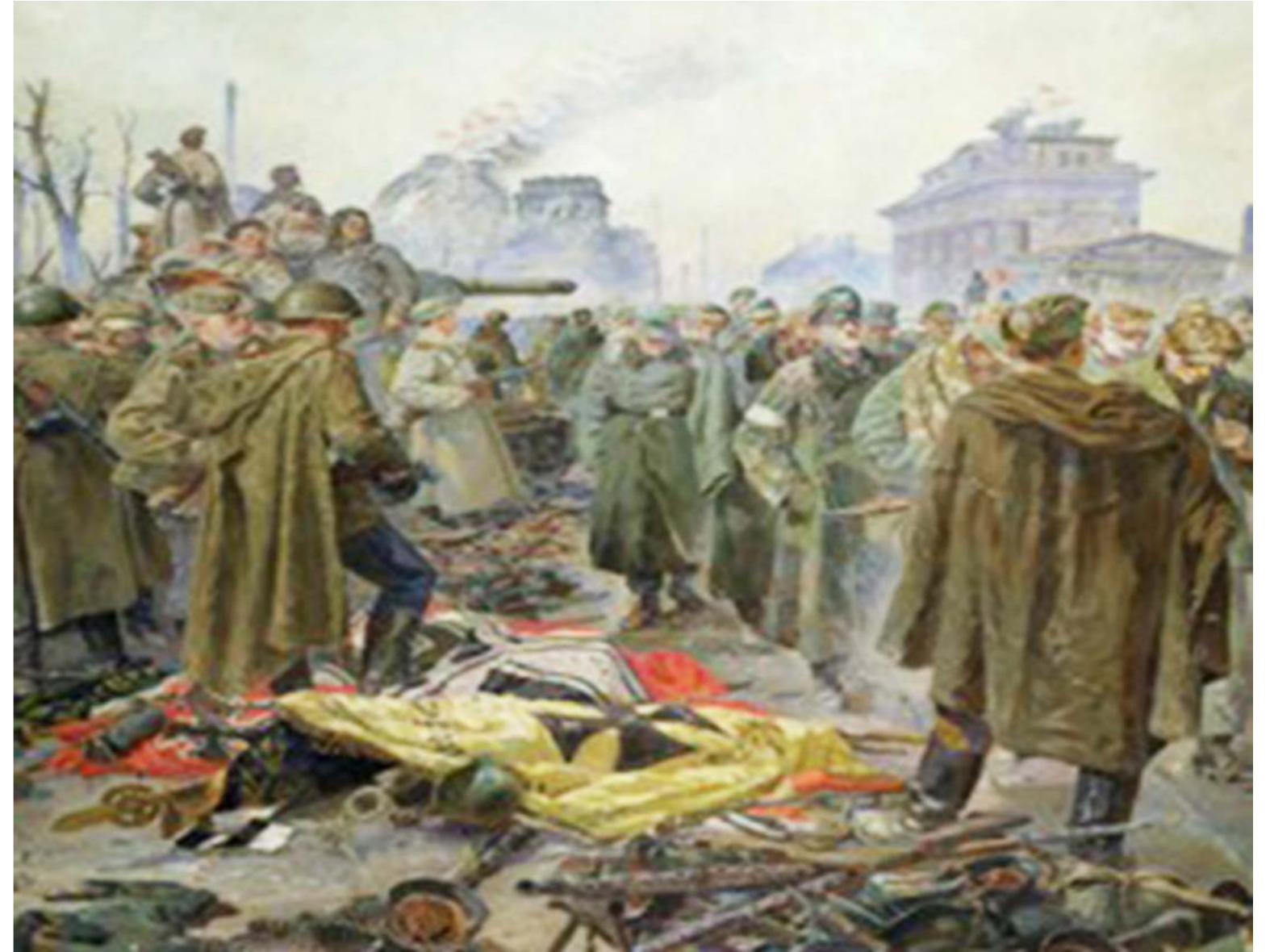
Capitulación de las tropas nazis en Berlín. Cuadro de Piotr Krivonogov.

Las primeras granadas del conflicto en Europa detonaron