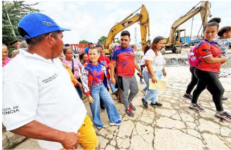
Había maquinaria pesada

“Como saben, hace días estuvimos aquí cuando se iniciaron