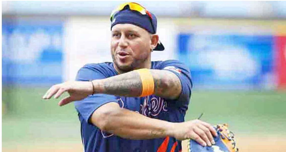
Asdrúbal Cabrera fue un bate oportuno en la LVBP y la MLB

“Hemos confirmado todo el staff técnico para la próxima campaña con una mezcla de experiencia y talento que proyecta guiar al equipo hacia la senda victoriosa. Constituímos el grupo de instructores alrede-