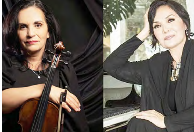
Ambas maestras tienen trayectoria como docentes en nuestro país.

En 2021 grabó el CD de F. Schubert . Se ha presentado en diver-