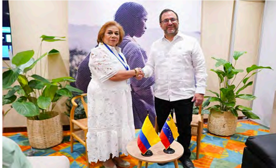
Gil: "Esta emotiva visita nos recuerda los lazos de hermandad que nos unen"

Durante la reunión ambas autoridades diplomáticas revisaron los temas de trabajo conjunto entre Caracas y Bogotá