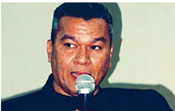
Rojas tiene una amplia experiencia como docente en áreas científicas

T/ Redacción CO