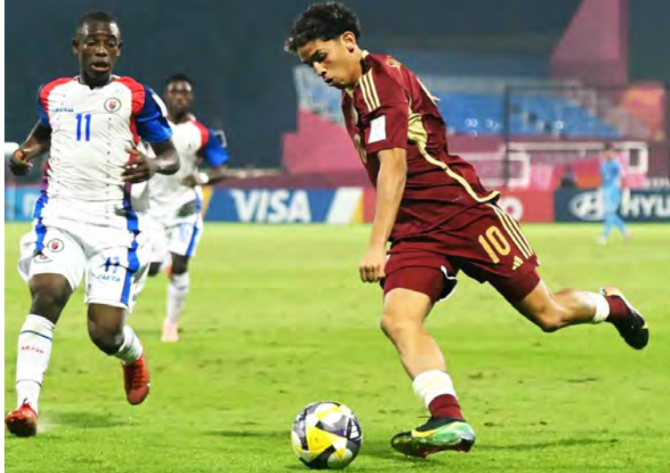
La nueva generación da esperanza a la Vinotinto