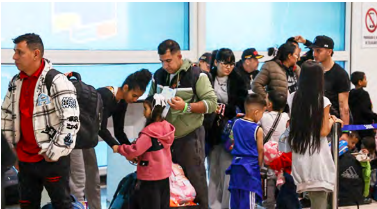
“Somos víctimas de distintas agresiones, pero que no han podido ni podrán torcer el rumbo pacífico”, dijo Yván Gil

hemos recibido este que es el vuelo 76, y con él llegamos a la cifra de 14.407 compatriotas (...) La aerolínea Eastern Airlines, avión con matrícula norteamericana solicitó su permiso para entrar en el territorio venezolano por las autoridades aeronáuticas norteamericanas hace un par de días”. En ese contexto, señaló que el presidente de la República, Nicolás Maduro, giro instrucciones al Instituto Nacional de Aeronáutica Civil (INAC), para que autorizara el arribo al país del vuelo procedente de Estados Unidos. “Es una demostración de la capacidad del Gobierno Bolivariano, nuestras instituciones de la patria, de la fortaleza de este gobierno, para recibir con los brazos abiertos a estos compatriotas que retornan a la patria”, enfatizó. Al respecto, señaló que los migrantes repatriados se incorporarán a la vida laboral y social del país para continuar garantizando la paz y estabilidad social que ha mantenido el Gobierno y pueblo venezolano. “Venezuela está más firme que nunca, estamos en paz, en