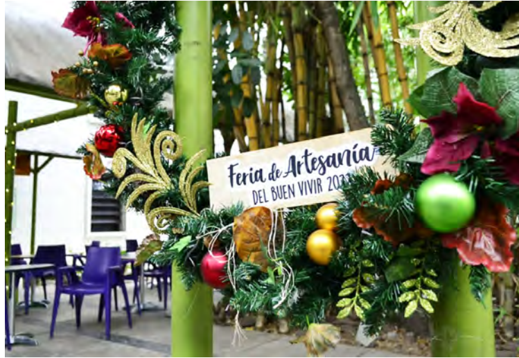
Hasta el 11 de diciembre permanecerá el evento en la GAN.