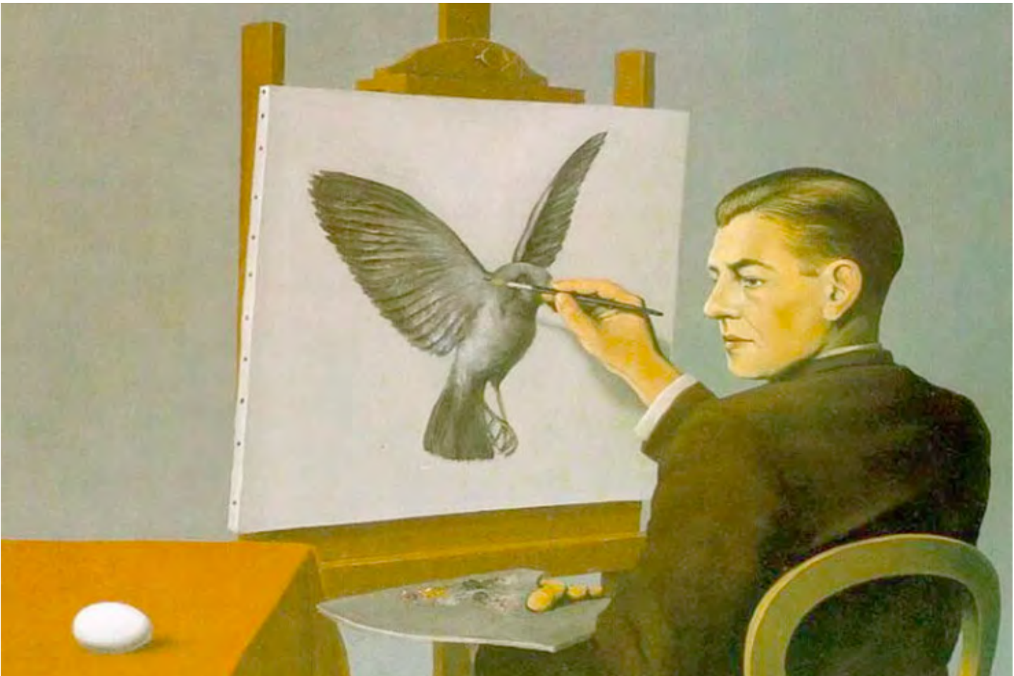
René Magritte Clarividencia (Autorretrato)

Todo el capitalismo, en su obsesión por endulzar las cadenas para que no duelan, ha convertido la estética en un dispositivo anestésico. Podría decirse que toda la maquinaria de la publicidad, del entretenimiento, de las plataformas y algoritmos, es una gigantesca fábrica de ilusión sensorial destinada a ocultar la violencia estructural que sostiene al sistema. Una estética de la alienación, donde la belleza es una mercancía más, una fachada para la barbarie. Pero esta frase irrumpe como un relámpago en la tormenta, propone invertir la ecuación. Propone que la belleza no sea un truco sino una consecuencia ética. Propone que la estética del futuro, hoy mismo brote de la justicia y no del mercado, de la dignidad y no del fetichismo, de la humanidad y no del espectáculo. Esta inversión no es un juego literario; es una tarea política radical. Es un llamado a descolonizar la sensibilidad, a arrancarle al capital los hilos con los que manipula nuestras percepciones, a construir un horizonte donde lo bello