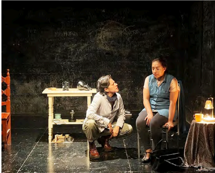
La autora fue egresada de la Unearte

La pieza Mujermente hablando estuvo ayer en el 77 Centro Cultural Autogestivo de la Ciudad de México como tributo a la autora fallecida en 2024