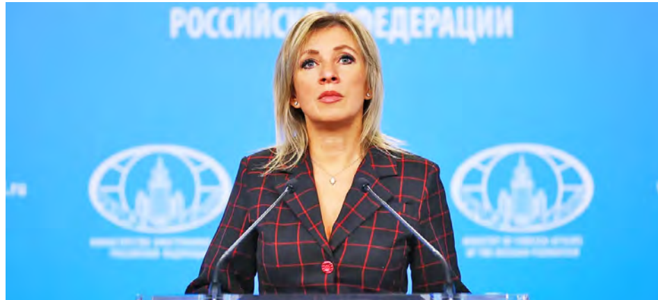
“Confiamos en que la Casa Blanca logre contenerse de seguir deslizando hacia un conflicto de gran escala”, dijo Zajárova

Rusia aspira que Estados Unidos (EEUU) evite que la situación con Venezuela se convierta en un conflicto a gran escala que amen-